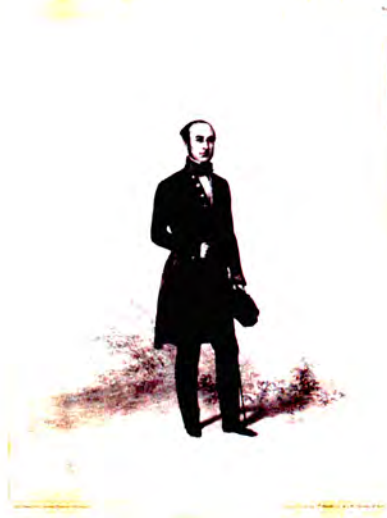
Fig. 2 – Frédéric le Play