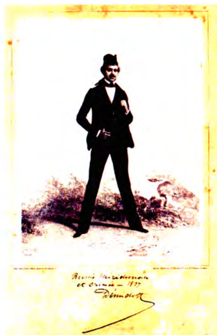
Fig. 1 – Anatole Demidoff

d'études anticipatrices est une juste réparation. Il faut également reconnaître que l'activité qu'il a déployée inlassablement attendu service aux relations culturelles entre la Russie et l'Occident.