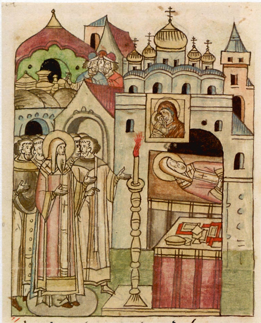
«Моление у гроба митрополита Петра в Успенском соборе перед поездкой в Орду». Миниатюра Повести о Алексии митрополите из Лицевого свода. Остермановский I, л.745об. Вторая половина XVI в. ОР. БАН. 31.7.30.