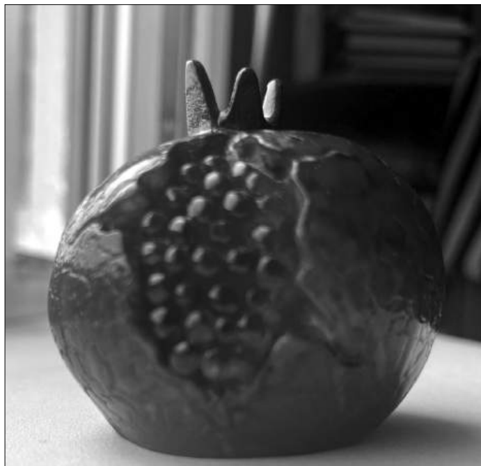
Илл. 1. Декоративный гранат

1.1. Настольные «гури». К этому виду относятся декоративные гранаты и кораблики из разнообразных материалов (серебра, бронзы, гипса, дерева, папье-маше, пластика, бусин, стекла и пр.), домики, деревья, в том числе новогодние ели, настольные обереги в виде глаза, защищающие от порчи. Предметы этого типа ставятся обычно в доме на видное место, в прихожую или гостиную, и находятся там в течение всего календарного года, а потом их сменяют новые «гури» (см. илл. 1).