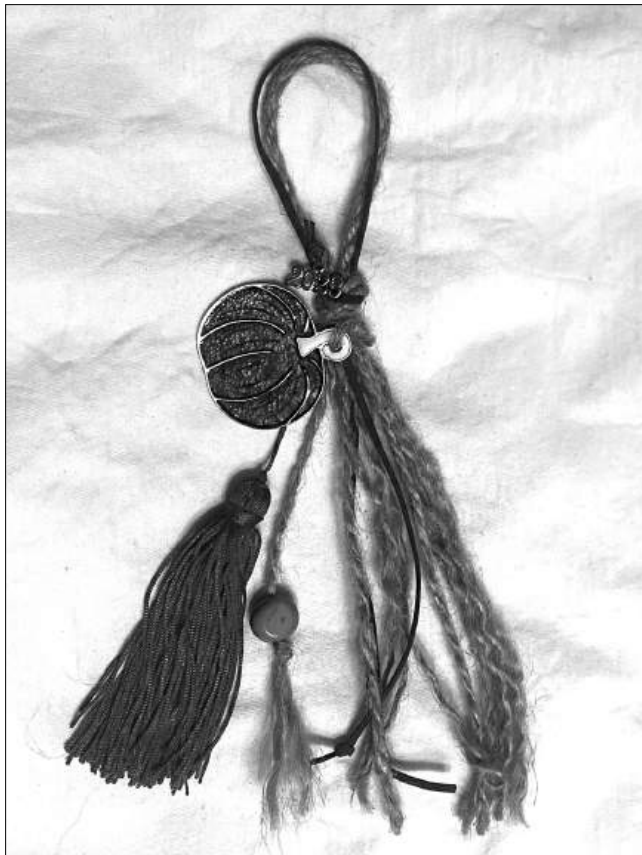
Илл. 5. Подвесной «гури» 2023 г. с декором в виде тыквы, красной нити и голубой бусины «от сглаза», имеющих апотропеическую символику