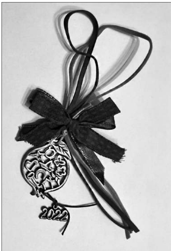
Илл. 8. Карманный талисман с декоративным гранатом и цифрами «2022»