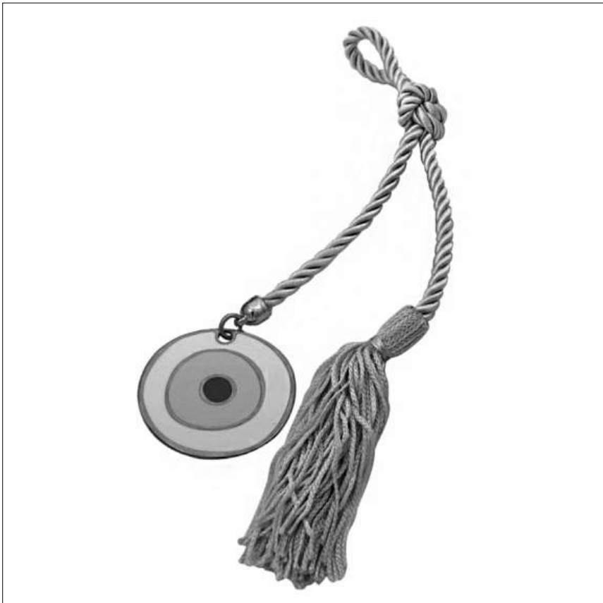
Илл. 9. Карманный талисман в виде камня-оберега от сглаза и декоративной кисточки (иллюстрация с сайта https://www.gaiadiaxeiros.gr/index.php?route=product/product&path=20&product_id=282 )