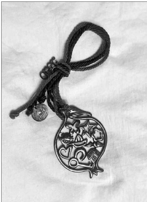
Илл. 2. Подвесной «гури» 2020 г. с декором в виде пятидрахмовой монетки и гранаты с изображением кораблика, дома, ключа, подковы, четырехлистного клевера