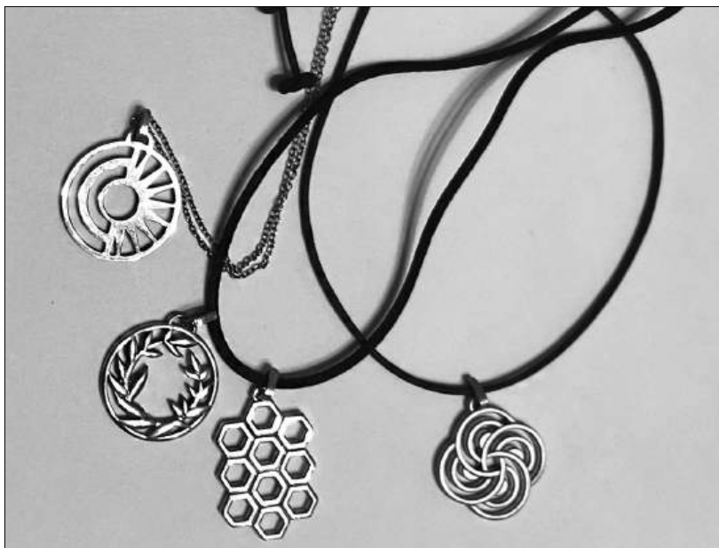
Илл. 7. Женские подвески-«гури» ювелирной фирмы «Золотас»