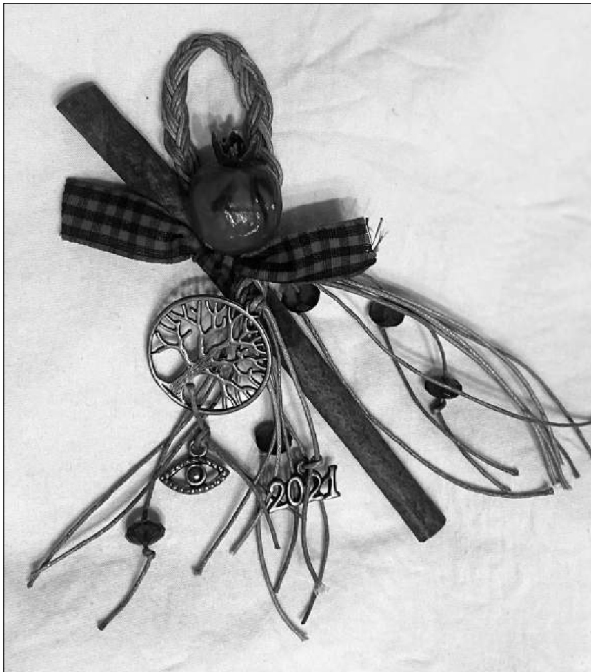
Илл. 3. Подвесной «гури» 2021 г. с декором в виде дерева, глаза, граната