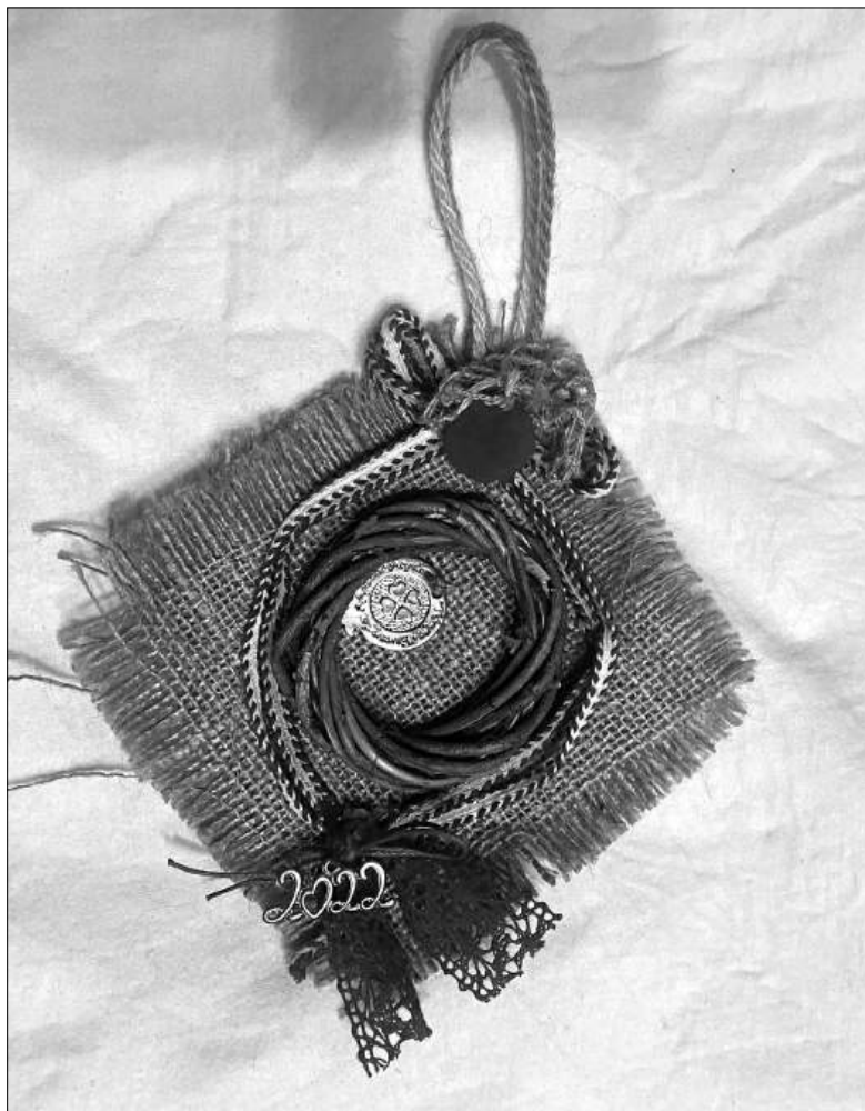
Илл. 4. Подвесной «гури» 2022 г. с декором в виде гнезда и граната с изображением четырехлистного клевера