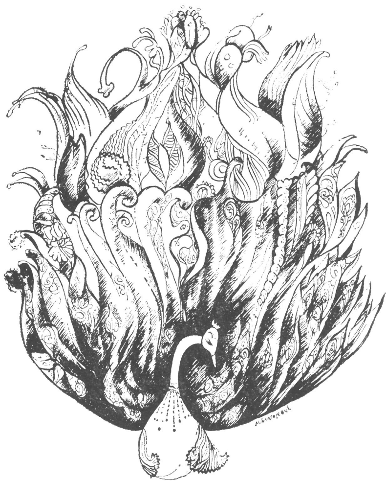
Мирослав Благојевић: Птица