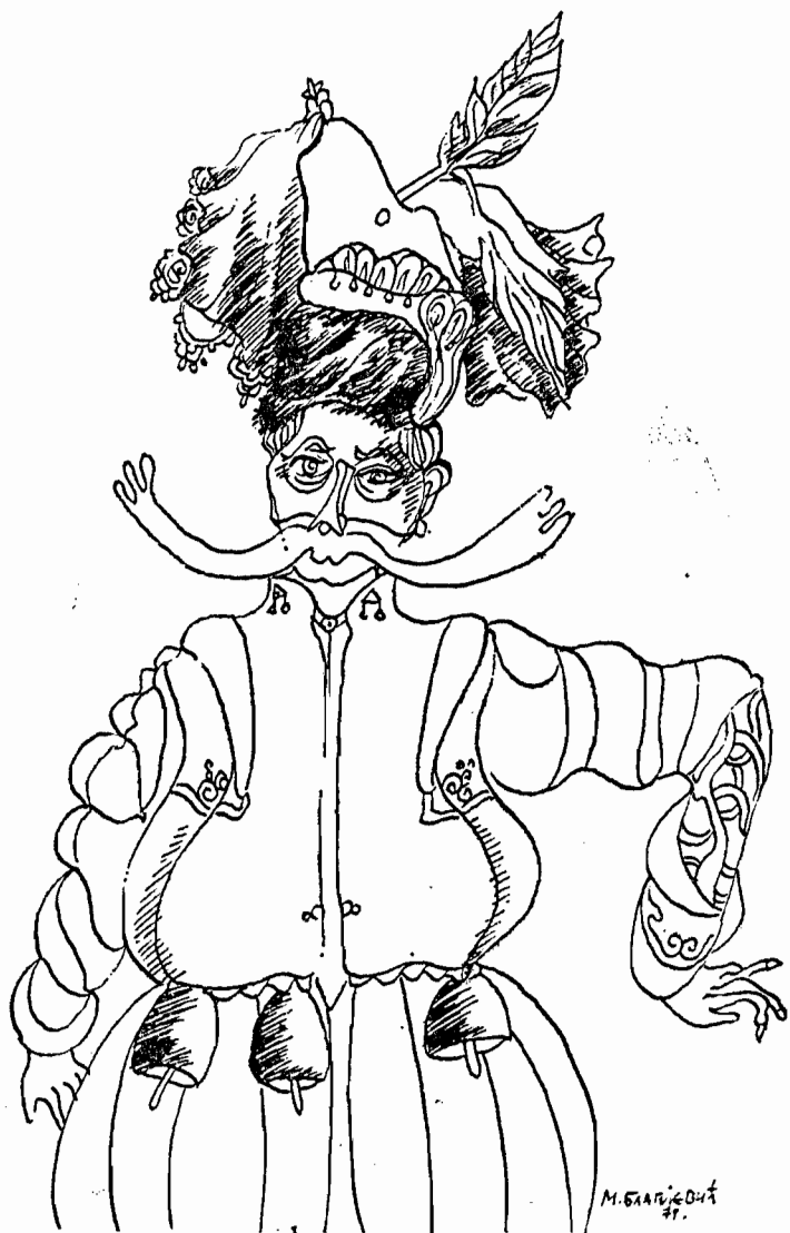
Мирослав Благојевић: Чобанин