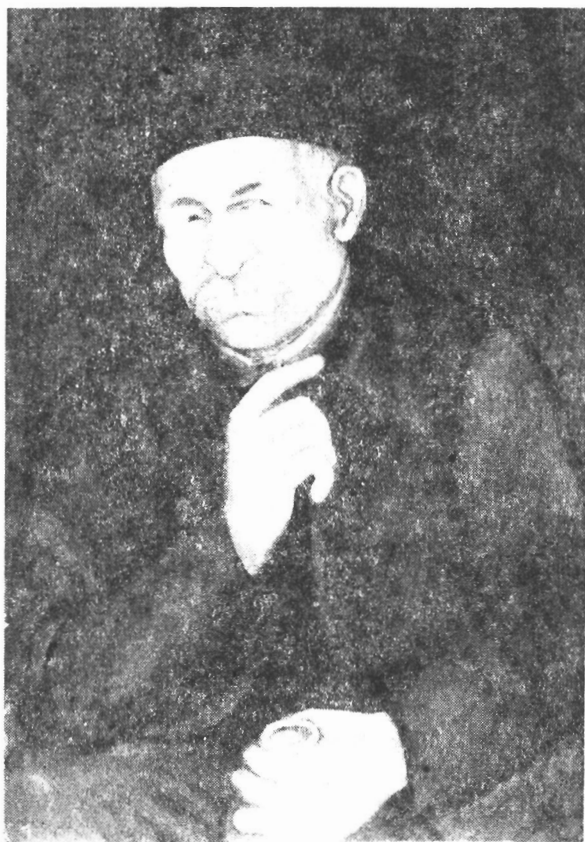
Јанко Брашић: Препредењак

1982. Мирослава Бошковић: Јанко Брашић , „Вук Караџић“, Београд. Прва монографија о Јанку Брашићу.