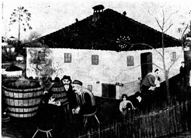
Јанко Брашић: Печење ракије