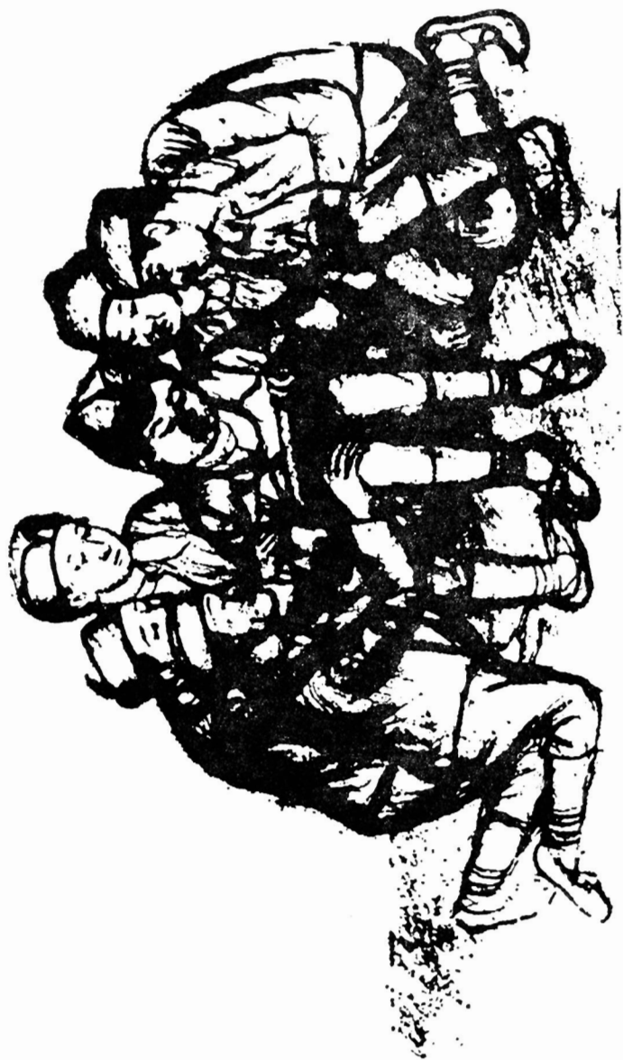
Јанко Брашић: Мали учитељ