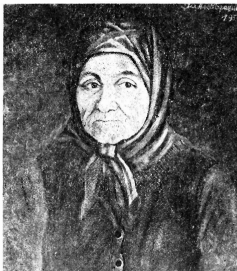
Јанко Брашић: Портрет старице