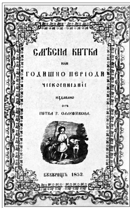
Обложка первого издания сборника стихов П.Р. Славейкова «Пестрый букет» (Бухарест, 1852)