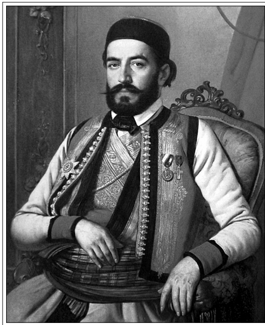
Портрет Негоша в светской одежде с черногорской шапкой

Как подлинно национальный поэт, Негош все свое творчество посвятил многовековому противостоянию черногорцев османской Турции, в котором небольшой, но стойкий народ остался непобежденным. Лирику поэта отличает органичная, глубокая связь с фольклором: уже ранние его стихотворения были написаны в духе народной поэзии с использованием ее образности, размеров и ритмики. Они вошли в опубликованный в 1834 г. сборник Негоша «Лекарство против ярости турецкой» / Лијек јарости турске . В посвященной А.С. Пушкину поэме «Свободиада» / Слободијада (1835) Негош с эпическим размахом описал сражения черногорцев с мно-