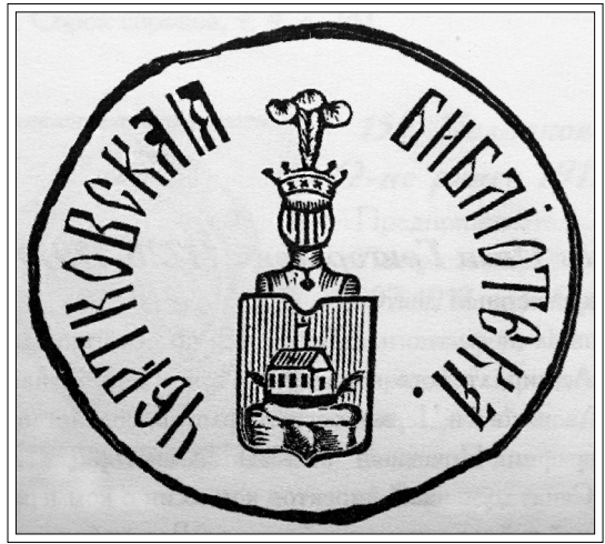
Экслибрис библиотеки Александра Дмитриевича Черткова

По воспоминаниям современников, А.Д. Чертков всячески поощрял интерес к прошлому России и славянских земель, находя «высокое наслаждение» в содействии, по возможности, тому, «чтобы свет знаний разливался как можно шире и дальше» в русском обществе. Все, кто любил историю, пользовались его книгами, а московские ученые не только работали в его библиотеке, но и брали книги на дом. Еще при жизни Черткова его библиотека сделалась достопримечательностью интеллектуальной Москвы.