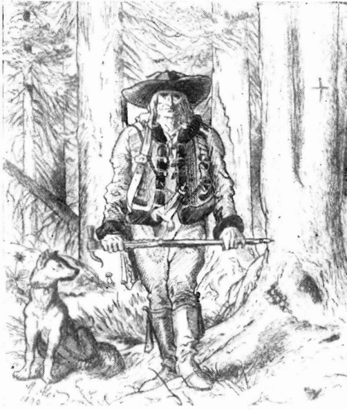
Рис. 5. «Ход на страже». Рисунок пером, 1899

Весьма существенна и вторая черта, свойственная историческим произведениям Алеша. Мы имеем в виду определившую их характер патриотическую и демократическую избирательность художника. При знакомстве с его произведениями невольно приходят на память слова Гоголя: «Бей в прошедшем настоящее и в двойную силу облетится слово твое» 12 . Они могли бы стать девизом к творчеству Алеша. Обращение к истории было для художника формой участия в борьбе, его вкладом в освободительное движение чешского народа.