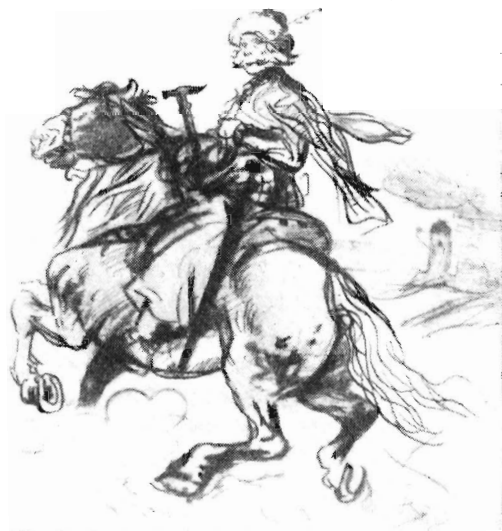
Рис. 3. Гуситский гетман. Рисунок углем, 1892

Существенное место в графическом наследии Алеша занимают многочисленные образы людей из народа, хронологически относящиеся к побелогорскому периоду. Это прежде всего разнообразные типы чешских крестьян и горожан XVII—XIX вв., участников сельских восстаний. Особое внимание художника привлекло легендарное восстание ходов, в частности героический образ одного из его руководителей Яна Сладкого (Козины), казненного в 1695 г. после подавления восстания. Алеш воссоздал образы сельских повстанцев: «Крестьянин из Хлумца» и «Тип участника крестьянского восстания» (1883). Довольно часто обращался Алеш к изображению военных (кирасир, драгун, улан, гусар и т. д.), видя в них молодых чешских крестьян, не по своей воле покинувших родные края. Огромную галерею исторических народных образов венчают собою рисунки упомянутого выше «Шпаличека».