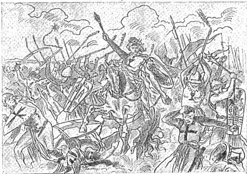
Рис. 1. «Божьи войны». Рисунок пером, 1885

Другим мощным импульсом, обусловившим интерес Алеша к отечественной истории, были книги по истории, которых он перечитал множество. Будущий художник часто посещал Императорскую библиотеку в Праге. Он хорошо знал основные труды чешских историков, начиная от Франтишека Мартина Пельцля, впервые по-чешски изложившего древнюю национальную историю («Новая чешская хроника», 1791—1796), до крупнейшего чешского историка XIX в. Франтишека Палацкогo, автора