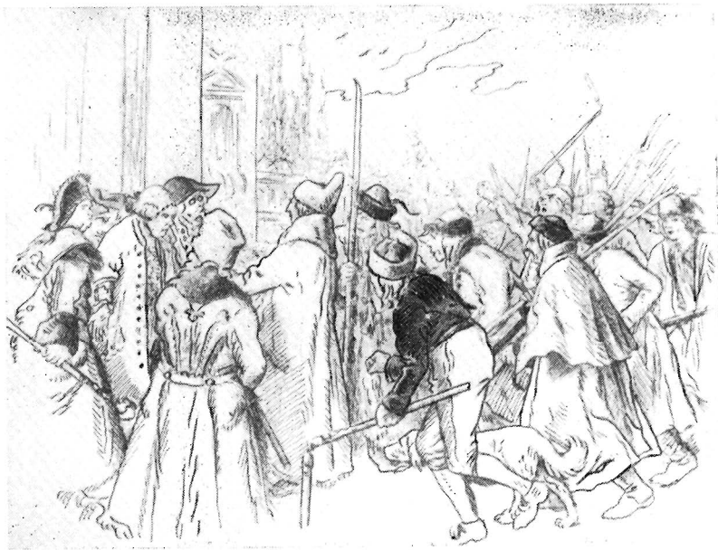
Рис. 4. «Из времен сельских восстаний». Рисунок пером, 1899

из названных традиций в процессе развития чешской общественной идеологии не был одинаков. Однако сказанным представление об исторической концепции Алеша все же не исчерпывается. Острый интерес и положительное отношение к крестьянским восстаниям XVII—XVIII вв., эпохе чешского национального Возрождения и всевозможным проявлениям освободительной борьбы во второй половине XIX в. (революция 1848 года, таборное движение 60-х годов, забастовки и массовые выступления рабочих, общедемократическая борьба за всеобщее избирательное право) не менее показательны для нее. В этом отношении характерны такие рисунки