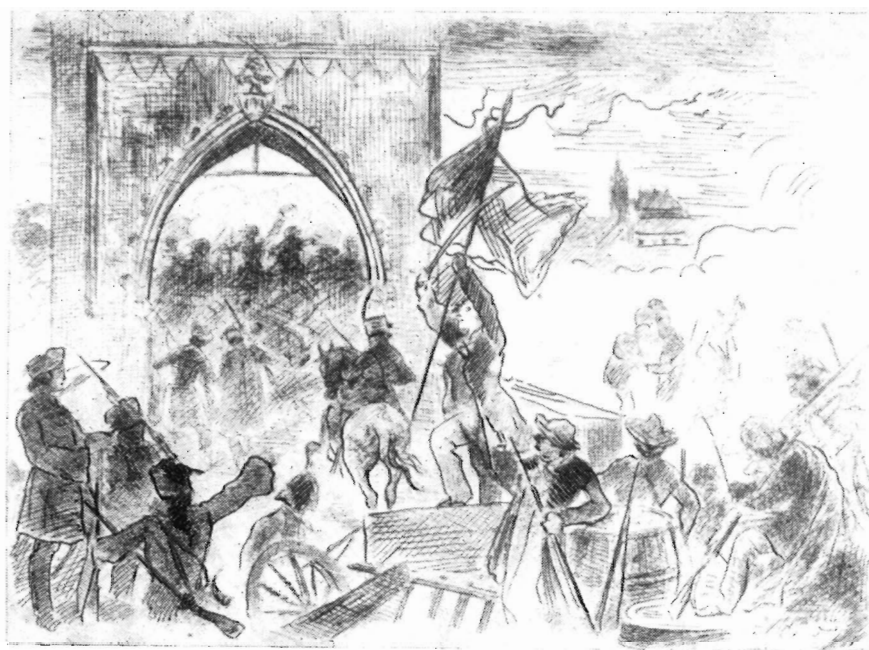
Рис. 6. «Год 1848». Рисунок пером, 1881

тронуло более широкую сферу культурной и общественной жизни, стало духовной пищей широких народных масс. Демократизм художника в понимании истории был более последовательным, патриотическое раскрытие смысла истории близко и доступно простым чешским людям. Именно поэтому Алеш и стал одним из «властителей дум» своего времени, именно поэтому его творчество столь характерно и показательно для своей эпохи, таит в себе ее живое дыхание, показывает, как велико значение истории в жизни народа.