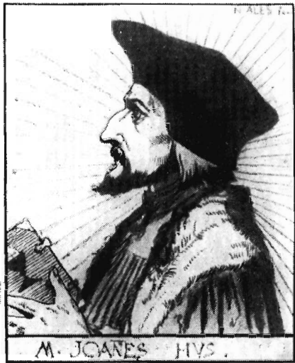
Рис. 2. Ян Гус. Рисунок тушью, 1878—1880

Крайне важно и показательно, что зрительные представления о прошлом Чехии Алеш вызывал не только посредством образов выдающихся национальных деятелей. Думая об исторических судьбах родины, он никогда не забывал о главном — самом народе, его безвестных представителях, живших, трудившихся и воевавших в разные эпохи. Об этом со всей очевидностью свидетельствуют рожденные его творческой фантазией, подкрепленной скупыми данными археологии и истории, изображения спутников легендарного Чеха, древних славянских богатырей, обживавших чешскую землю в далеком прошлом, земледельцев и воинов. Не менее интересны среди образов безвестных участников важных исторических событий и многочисленные алешевские гуситские гетманы. Алеш показывает их в разных ситуациях, и в дни славы и в трагических обстоятельствах. Разнообразно выражение лиц гетманов, разнообразны характеры, однако всех их объединяет запечатленная в выражениях лиц су-