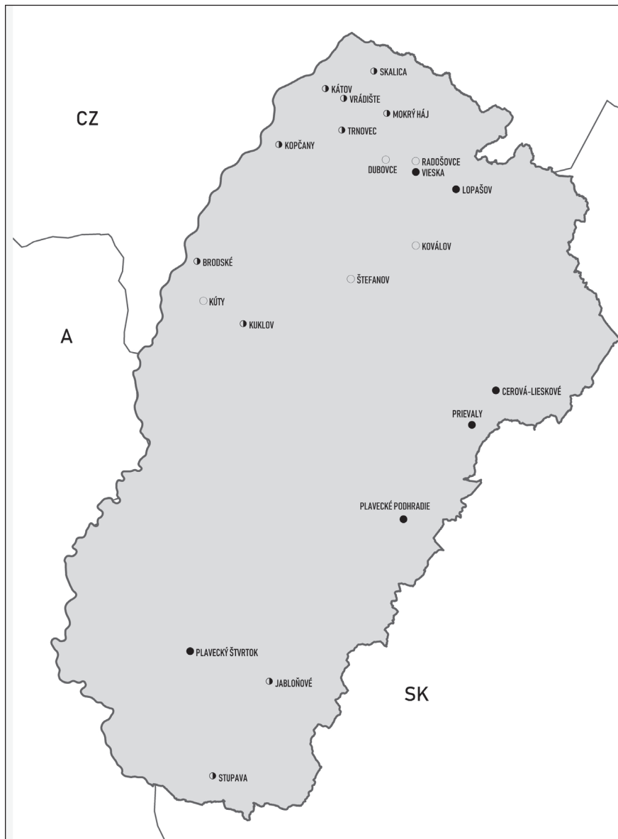
Карта 1. Расположение загорских говоров