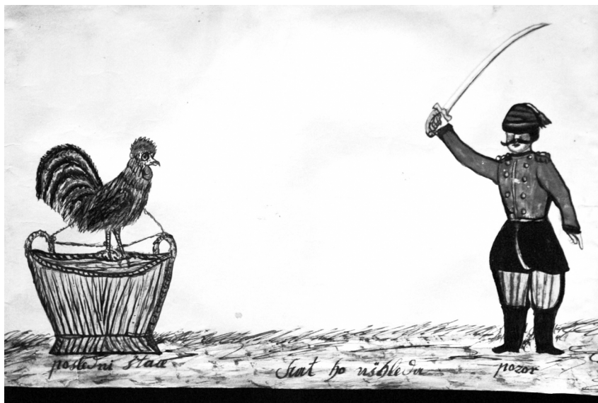
Обезглавливание петуха, раскрашенный рисунок из г. Високе-Мито (Восточная Чехия), 1895 г.

ФДЗ РГГУ — Фонотека диалектных записей кафедры СиЦЕИ РГГУ.