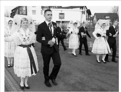
28 Jugendliche zogen in der Fastnacht in wendischer Festtagsracht durch Burg. Sie tanzten, sangen und sorgten so für gute Laune.