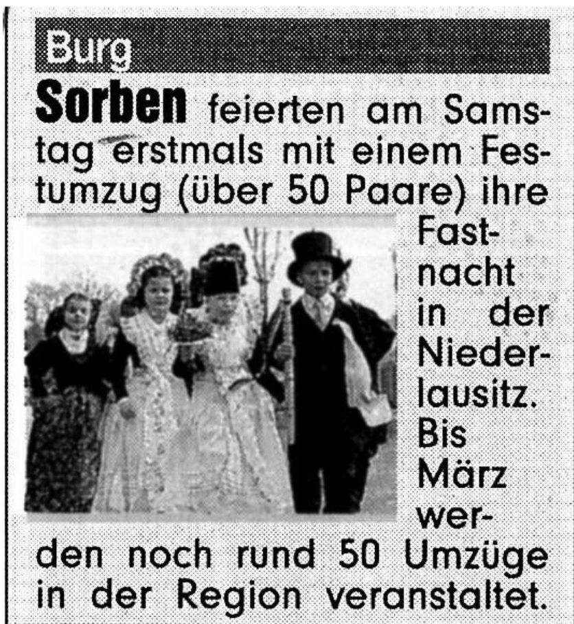
Иллюстрация 6. 26.01.2004.