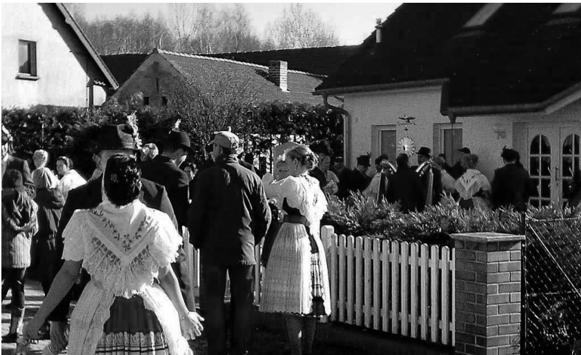
Иллюстрация 2. Праздничная процессия заходит во двор дома в Дешно (26.02.2012).