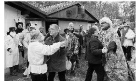
Auf einer neuen Route waren die Jugendlichen des Bürgervereins Ströbitz und die Traditionsgruppe „Thimais Zinnreuer“ am Samstag im Ströbitz unterwegs. Die Dittbour um Geld und Eier führte sie bis zur Stadtgrenze am Zalsowweg. Dort zwanzigerten sie sich mit Musik und einem Tanz bei den Familien-Krögern und Schiller für deren Einladung zum Mittagsimbiss.