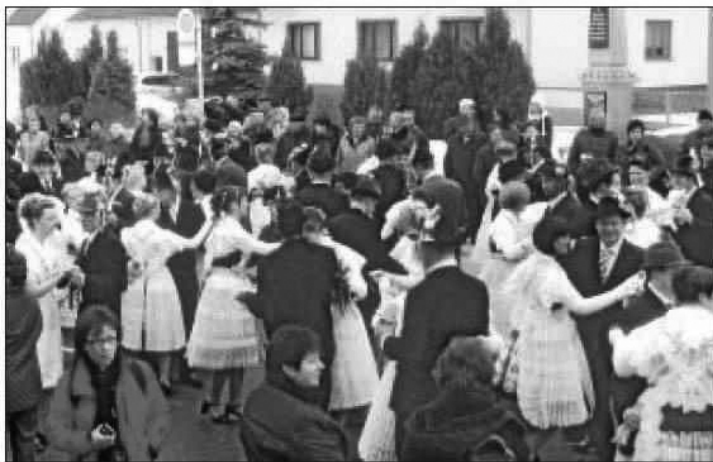
Dohromady 115 porow młodostnych a zmandželenych je so zawčerawšim, njedzelu, na 130. zapusće w Dešnje wobdžělilo.

W tydženjach do jubileja zetkawaše so znajmjeńša tydžensce 15 muskich ze wsy k zhromadnemu spěwanju. Štož běchu nawukli pokazachu, na zapustowych rejach. Najskekerje budu woni tež po zapusće dale hromadže spěwać. A snano nastanje takle samo wjesny muski chor, kajkiž mějachu w Dešnje hižo do léta 1945. Jeho chorhojz léta 1926 wisa w tamnišim domizniskim muzeju.