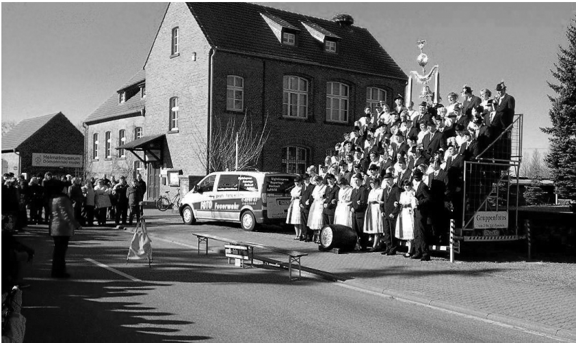
Иллюстрация 1. Фотографирование перед церковью в Дешно (фото: И. Келлерова).