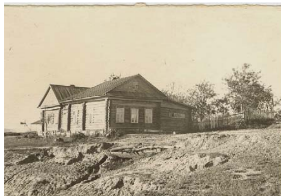
Дом Ходовых в г. Гаврилов Посад

Здесь наш дом стоял на пригорке, недалеко от реки. Река Ирмезь – приток Нерли – с