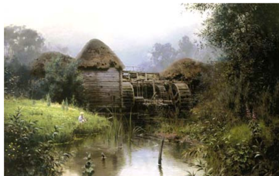
В.Д. Поленов. Старая мельница. 1880 г.

была совсем маленькой. Это был первый папин опыт, и ему было не трудно с ней расстаться.