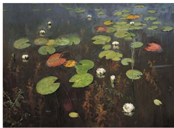
Левитан И.И. Лилии. Ненюфары. 1895 г.