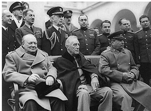
Черчилль, Рузвельт, Сталин в Ялте. Февраль 1945

Таким образом, И. В. Сталин добился согласия партнёров на то, чтобы в числе учредителей и членов ООН был не только СССР, но и Украинская ССР, и Белорусская ССР. И именно в ялтинских документах появилась дата «25 апреля 1945 года» — дата начала Сан-Францисской конференции, которой было предназначено выработать Устав ООН.