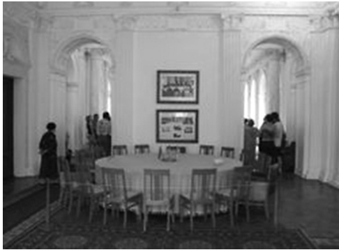
Стол переговоров «Большой тройки». Ливадия, Крым

са относительно зон оккупации Германии было достигнуто ещё до крымской конференции и зафиксировано в « Протоколе Соглашения между правительствами СССР, США и Соединённого Королевства о зонах оккупации Германии и об управлении „Большим Берлином“ » от 12 сентября 1944 г.