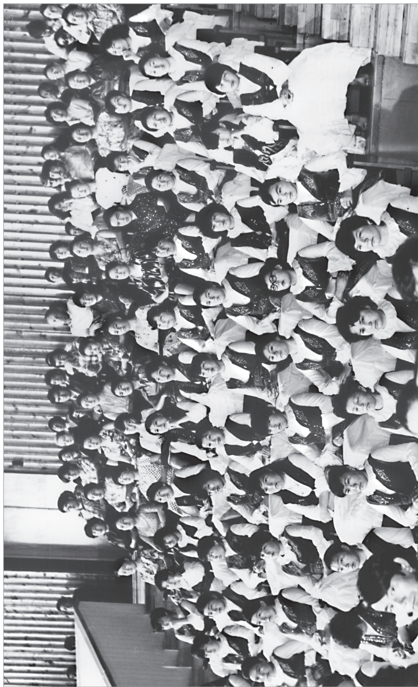
Фрунзе (Кирг.ССР). 1981 г. Общий вид зала заседания с участием приглашенных.