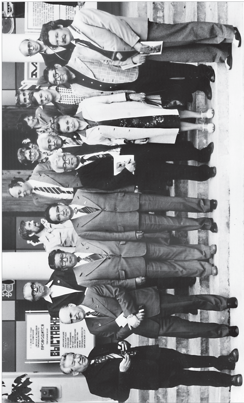
Фрунзе (Кирг. ССР). 1981 г. Группа участников и организаторов заседания