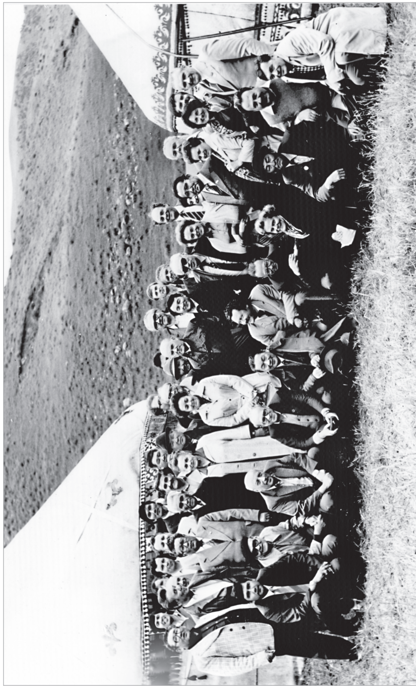
Фрунзе (Кирг. ССР), 1981 г. Группа участников и организаторов заседания на фоне киргизских юрт и степей.