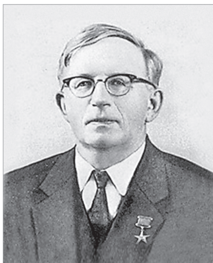
Петр Николаевич Поспелов – председатель советской части Комиссии (1967-1979 гг.)