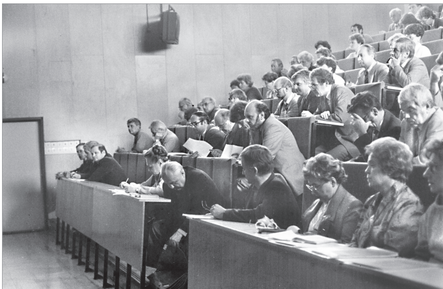
Банска Быстрица (Словакия). 1988 г. Зал заседания. Общий вид.