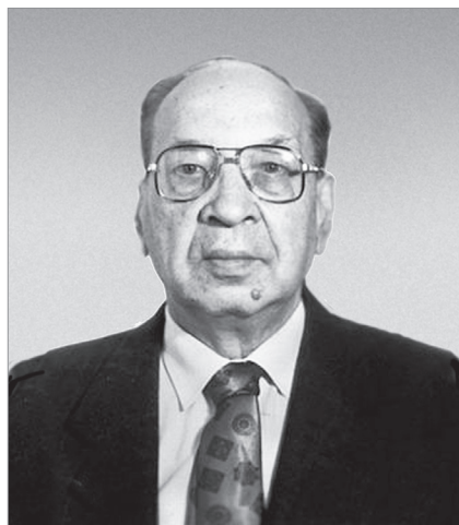
Григорий Николаевич Севостьянов – председатель советской части Комиссии (1989 г.)