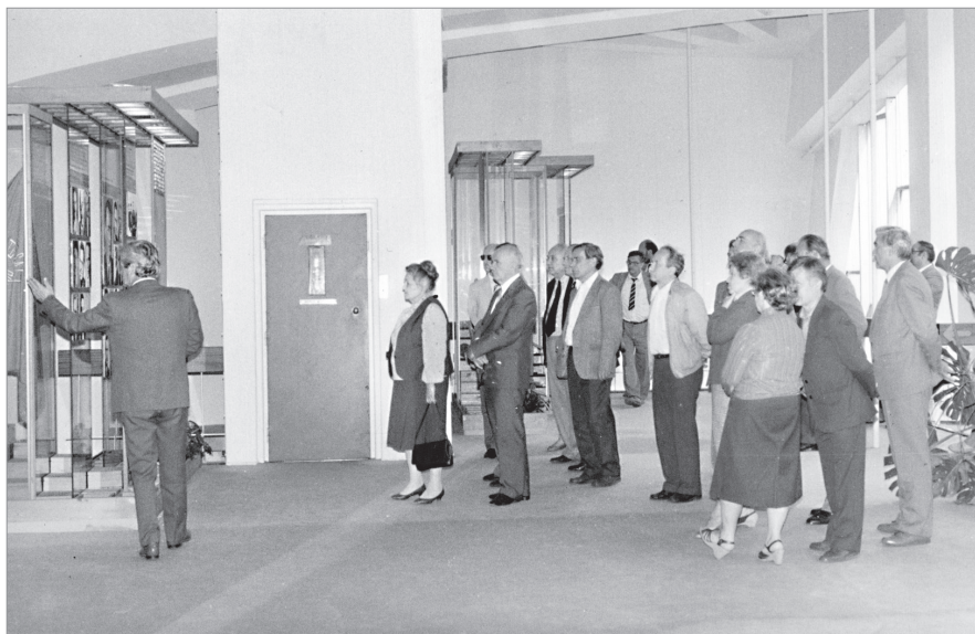
Банска Быстрица (Словакия). 1988 г. Осмотр музея.