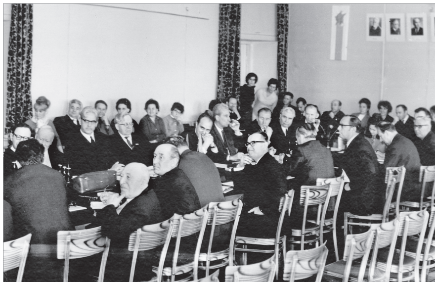
Москва. Май 1968 г. Общий вид зала заседания.