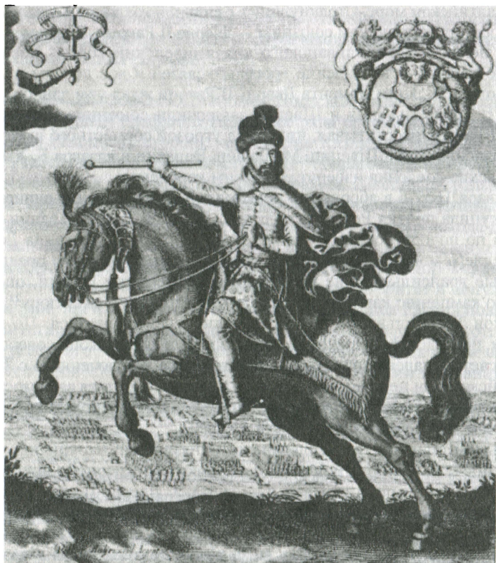
Трансильванский князь Дьердь II Ракоци

фехервар приезжали посольства Речи Посполитой, Порты, Крымского ханства, Запорожского Войска, Молдавии и Валахии 17 .