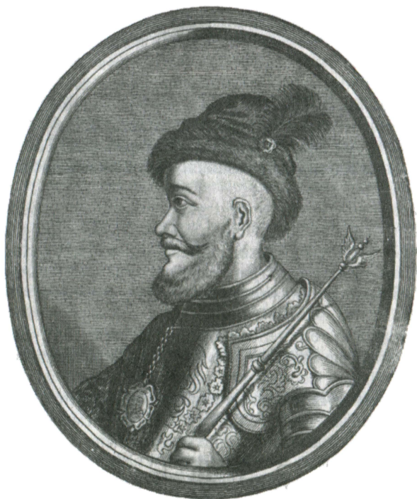
Трансильванский князь Михай Апафи

поняв, что князь не намеревается продолжать венгерский поход, окончательно вышел из-под контроля М. Апафи, а, следовательно, и за рамки трансильванской внешней политики. И. Тёкёли и основная масса скитальцев осенью 1678 г. вновь вторглись на территорию Венгрии. Тем не менее, эта акция еще не означала окончательного разрыва между куруцами и трансильванским двором, так как официально во главе скитальцев продолжал стоять М. Телеки. Лишь в 1680 г. И. Тёкёли сместил с этого места М. Телеки. Разрыв Трансильвании и куруцев не отвечал интересам Порты, которая предпочла бы, чтобы они выступали единым фронтом против Габсбургов.