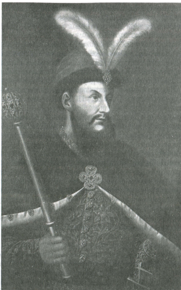
Гетман Петр Дорошенко

и гетманом П. Дорошенко стал назревать открытый конфликт. Ряд свидетельств (преимущественно в польских источниках) указывает на то, что частью планов П. Дорошенко, направленных на создание украинской державы, было уничтожение Запорожья с помощью османов и татар. 2 мая 1668 г. послы Я. Собеского сообщали из Крыма, что сюда прибыли послы П. Дорошенко, предлагая хану уничтожить Запорожье. В этом случае, заверяли они, Крым навсегда будет свободным от казацких набегов 71 . Еще ранее, в начале января 1668 г., власти Речи Посполитой сообщали русским послам в Варшаве, что в ответ на жалобы из Стамбула на набеги запорожцев, П. Дорошенко просил, чтобы хану было приказано дать ему войска, с помощью которых он мог бы уничтожить поселения казаков в районе порогов. Затем гетман предлагал султану поставить на этом месте крепости с осман-