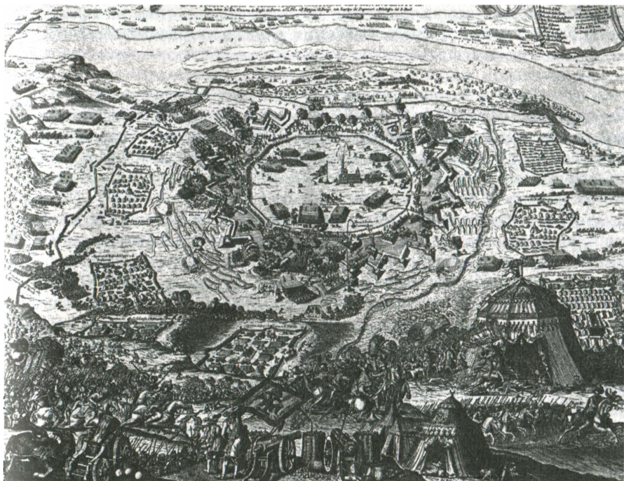
Осада Вены. 1683 г.

вых, он сильно торопился, чтобы застать Вену врасплох. Его армия совершила исключительно быстрый марш-бросок на огромное расстояние. Но ради того, чтобы выиграть время, великий везир не взял с собой достаточного количества тяжелых осадных орудий. Уже в начале осады турецкая артиллерия в количественном отношении проигрывала австрийской. Более того, по мнению современников событий и историков, у Кара Мустафы были более серьезные причины, по которым он не использовал при осаде Вены тяжелой артиллерии в нужных масштабах. Он хотел получить «Золотое яблоко» целым и невредимым для султана и для себя. Этого можно было бы добиться, принудив Вену к капитуляции, которая отдала бы ее в распоряжение главнокомандующего. Взятие же города штурмом превратило бы его в законную добычу солдат. Поэтому Кара Мустафа выжидал, надеясь на то, что Вена сдастся на милость победителя, и до поры до времени щадил ее 110 . Лишь во второй половине августа, когда стало ясно, что Вена намерена держаться до конца, великий везир обрушил на нее всю мощь османской военной машины. Но было уже поздно.