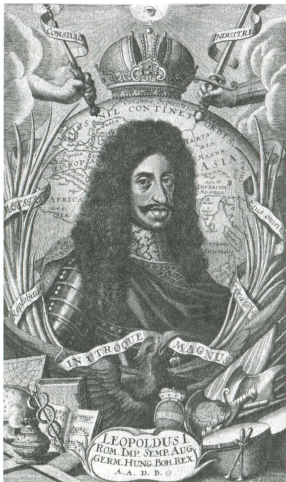
Император Леопольд I

заклятого врага Габсбургов Мазарини (9.III.1661), позволявшая надеяться на смягчение напряженности на Западе. Надо сказать, что лично Мазарини в принципе не был противником организации европейской войны с турками. Умирая, он завещал римскому престолу 200 тыс. эскудо на это предприятие 56 . В этом жесте кардинала символически отразилась вся политика Франции в турецком вопросе. Как христианин глава французской внешней политики помог бы императору раз и навсегда покончить с османским владычеством в Европе, но как противник Габсбургов, готов был подстрекать мусульманскую Порту против императора. В этот короткий период решительных действий Леопольд попытался также заручиться поддержкой христианских государств. К папе из Вены был послан маркиз Маттеи, чтобы при