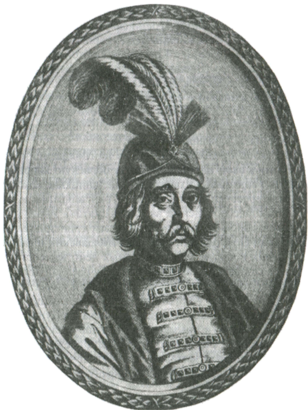
Молдавский господарь Георге Стефан

было сохранить свои сословные привилегии 13 . В письме подчеркивалось также, что только поневоле молдавские отряды вынуждены выступать вместе с татарами на помощь полякам, но как только царь пошлет свои войска против «нечестивых», они готовы с «царскими ратными людьми идти» 14 .