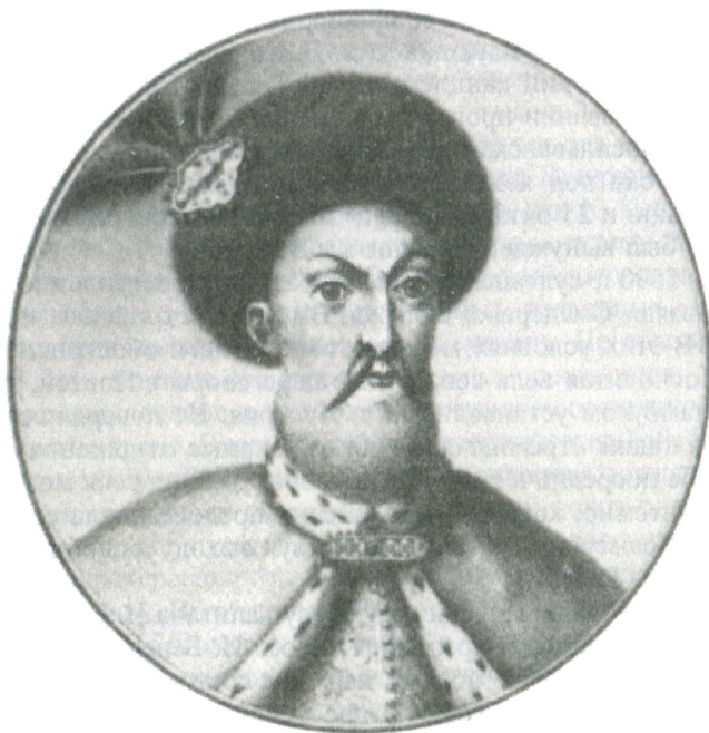
Валашский господарь Константин Брынковяну

в княжестве посланных султаном татарских войск не предвещало ничего, кроме разорений. Господарь поспешил сообщить имперскому командованию о появлении татар и просил отвести австрийские войска, чтобы избежать опустошения княжества 38 . Под напором татарских отрядов в конце января 1690 г. армия Д. Хайсслера вынуждена была отступить за Карпаты.