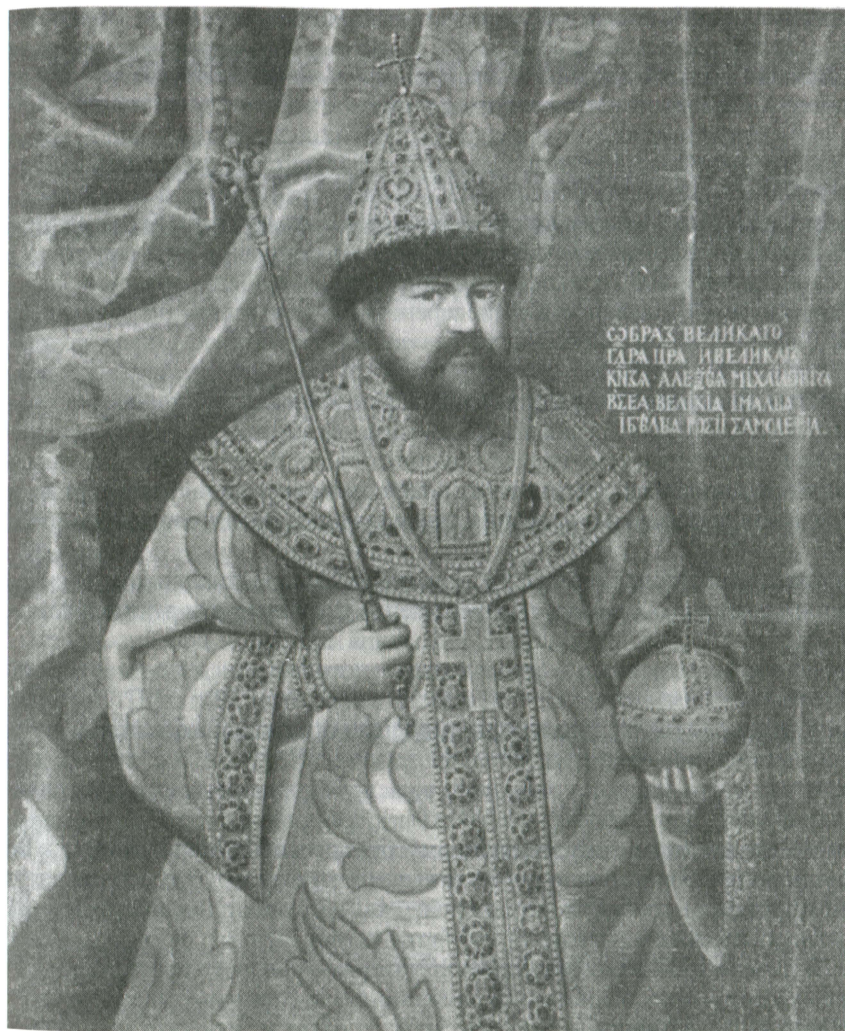
Портрет царя Алексея Михайловича. ГИМ

им сторонам Днепра под его властью. На протяжении 1666–1667 гг. быстро нарастало недовольство населения Левобережной Украины московской властью. Главной его причиной стали проводившиеся русским правительством реформы, направленные на ограничение автономии гетманства. Во многие украинские города были введены московские гарнизоны, проводилась перепись жителей, мещане и крестьяне облагались налогами в пользу царской казны, выбивать которые из населения должны были царские воеводы. Все это вело к резким трениям между русской администрацией и населением. В январе 1668 г. киевский воевода с тревогой писал в Москву, что «мещане