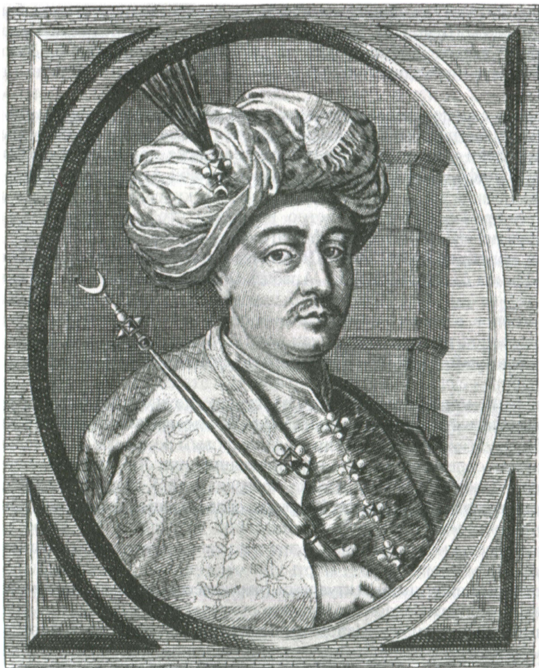
Султан Мехмед IV

вания финансовых проблем империи, принадлежащие перу Кятиба Челеби, – это одни из самых серьезных произведений такого рода, составленных османскими авторами в середине XVII в.