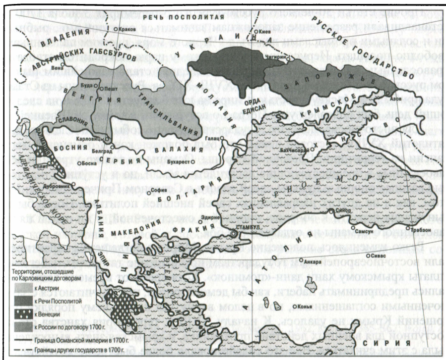
Территориальные потери Османской империи по договору 1699 и 1700 гг.*

ворах Украинцев даже запрашивал земли от Дона до Кубани). Впрочем, для османов уступка Азова была малозначащей в сравнении с громадными потерями в Центральной Европе и на Балканах. Русский флот они надеялись запереть в Азовском море и с 1702 г. начали укреплять Керченский пролив крепостью Ени-кале и каменной перемычкой до Тамани.