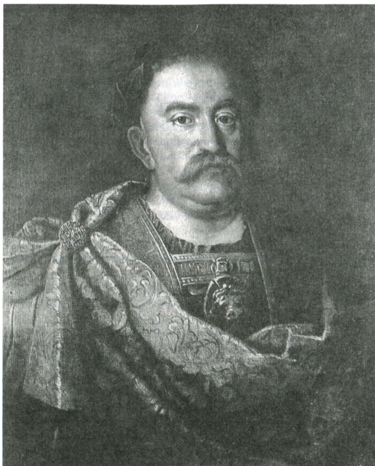
Польский король Ян III Собеский

1676 г. представители Я. Собеского подписали с османским командующим Ибрагим-пашой новый мирный договор 147 . В нем с некоторыми изменениями в пользу Речи Посполитой (отсутствовало требование «хараджа», в польских руках оставалась Белая Церковь) повторялись условия Бучачского договора. Речь Посполитая отказывалась в пользу Османской империи и от Подолии, и от земель на Правобережной Украине, входивших в состав «казацкой державы», следствием чего стал уход на территорию Полесья сражавшегося на польской стороне против османов казацкого войска во главе с О. Гоголем 148 .