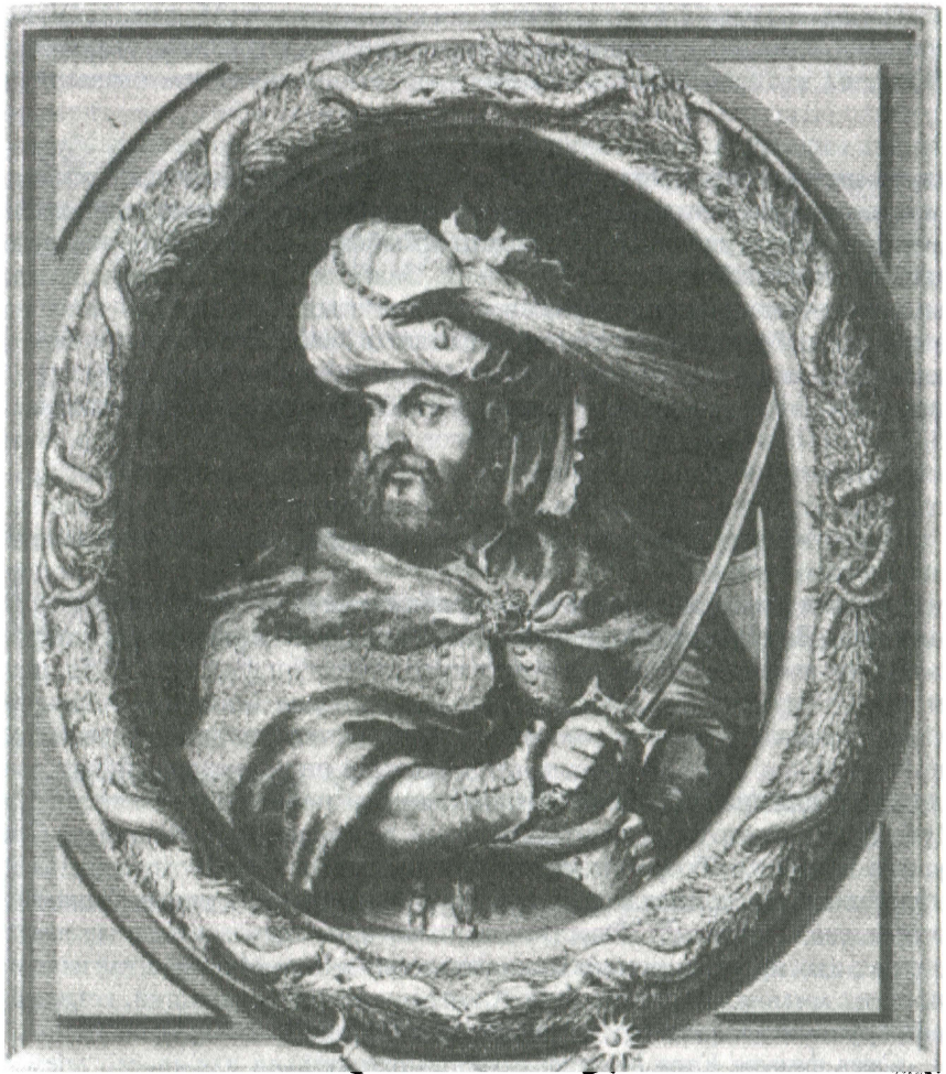
Великий везир Кара Мустафа

в Европе, а с другой стороны, характерная и типичная для турок конца XVII века. Она пронизана нестигаемой верой османов... в собственные силы, и нежеланием считаться с противником» 29 . После Вены такие настроения исчезают. Не случайно Наима (1655–1716), ставший официальным хронистом после венского разгрома, предостерегал от чрезмерного самомнения и высокомерия, подчеркивал, что неприятеля нельзя считать бедным и слабым 30 .