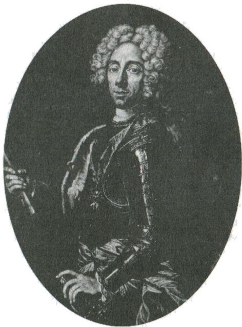
Принц Евгений Савойский

снова появился Эсек, который было необходимо взять, чтобы перекрыть дорогу османам в Венгрию.