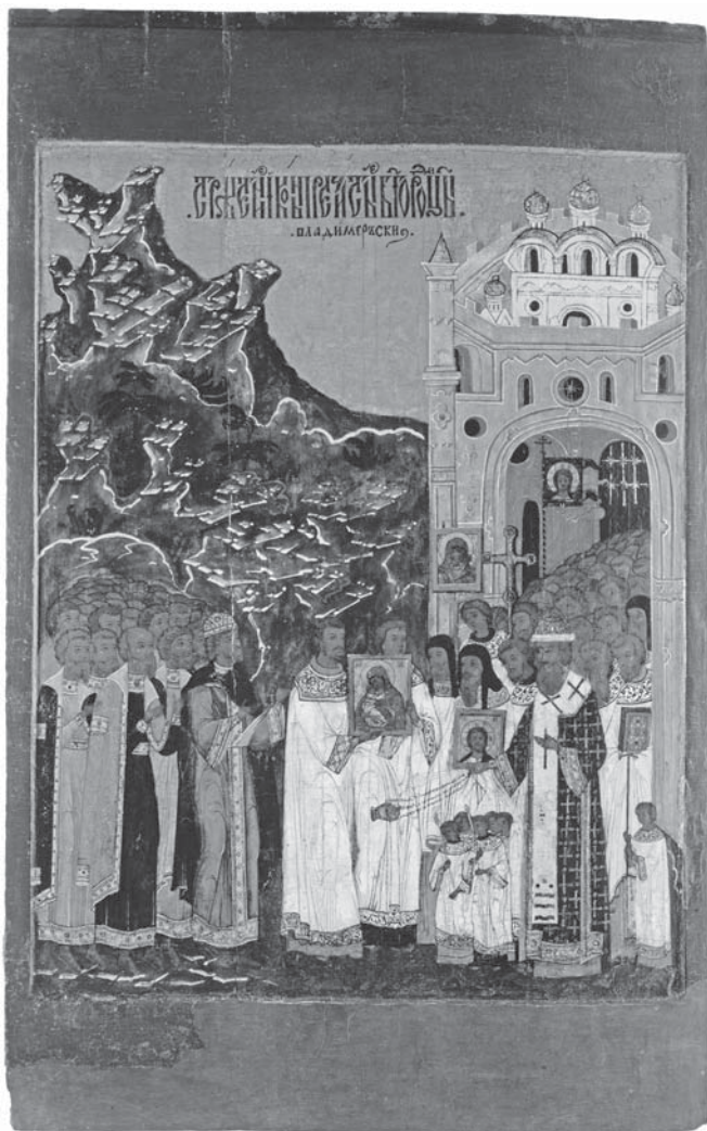
13. Сретение Владимирской иконы Богоматери в Москве. Икона. Середина XVII в. Из церкви Сретения Владимирской иконы Богоматери в суздальском монастыре во имя Свяtitеля Василия Великого. Владимиро-Суздальский музей-заповедник.

Иконы Сретения чудотворного Владимирского образа Богоматери XVII в. отличались оригинальным творческим решением, в них соединялись особенности изображений сюжета Сретения, изложенного в Повести и проиллюстрированного в Лицевом летописном своде,