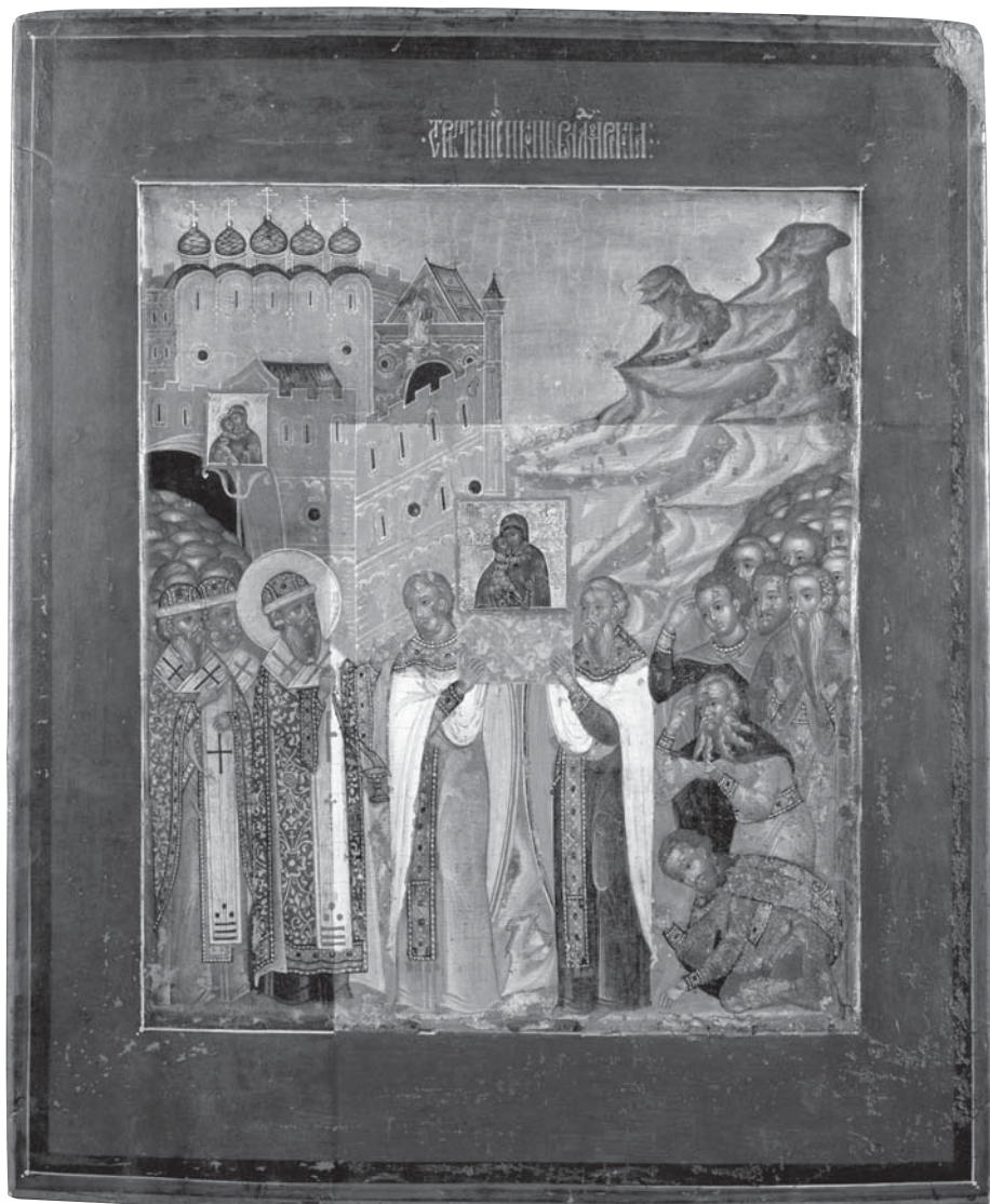
7. Сретение Владимирской иконы Богоматери в Москве. Икона-пядница. Конец XVI — начало XVII в. Мастер Семен Бороздин. Из коллекции С. Г. Строганова. ГРМ.