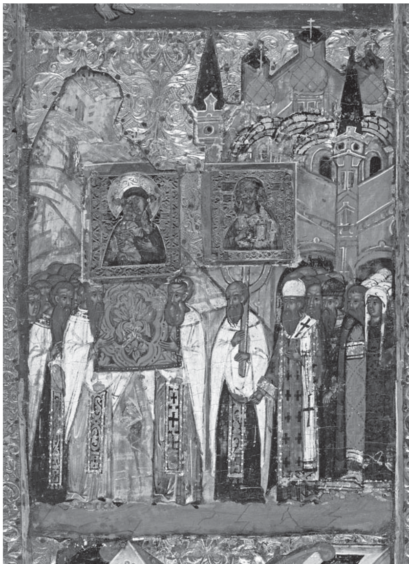
5. Сретение чудотворной Владимирской иконы Богоматери в Москве. Клеймо иконы «Богоматерь Умиление Владимирская, с клеймами жития Иоакима, Анны и Богоматери». Последняя четверть XVI в. Псковский музей.