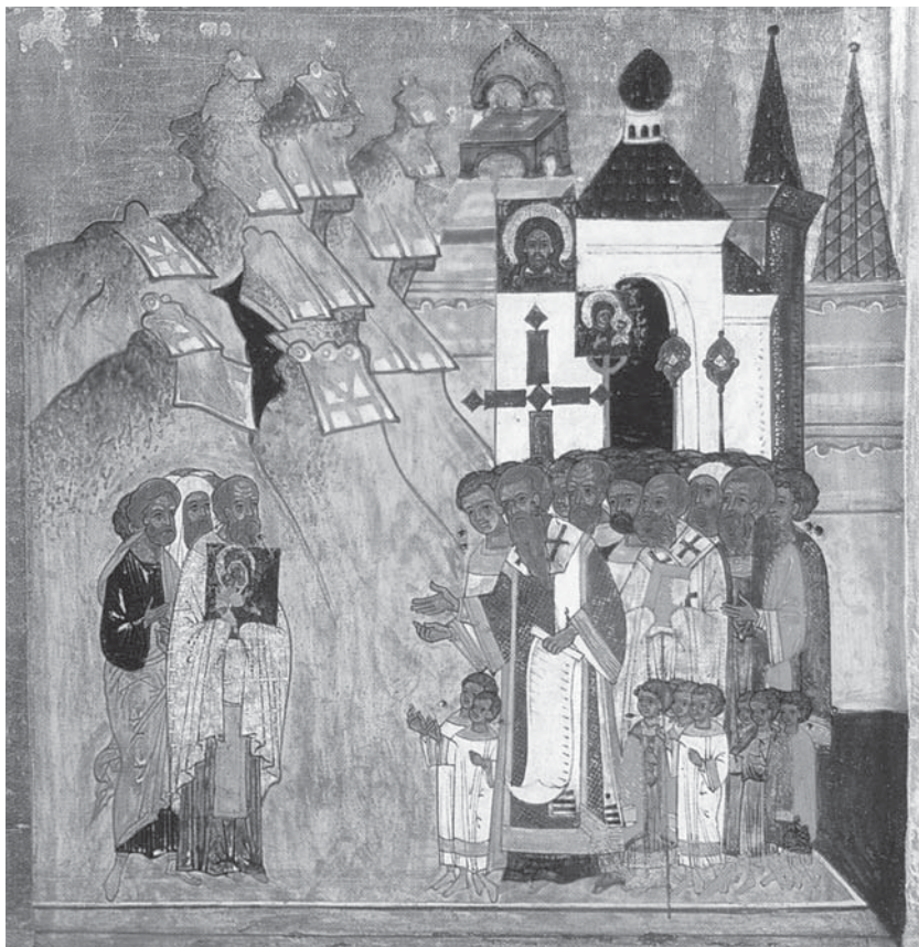
2. Сретение Владимирской иконы Богоматери в Москве. Клеймо иконы «Рождество Богоматери, с житием Богоматери и праздниками». 1566 год. Мастер Сухой Милово. Из церкви Леонтия Ростовского в Вологде. Вологодский музей.

но «народное празднество». Справа, на фоне белого города-башни простых обобщенных форм, с черным арочным проемом, плотная монолитная группа людей с двумя священниками, один из которых с развернутым белым свитком, другой — с закрытой книгой в покровенных руках; на первом плане — три группы детей в белых и цветных одеяниях; взрослые и дети в молении простирают руки к образу Богоматери Владимирской. Над головами многочисленной группы встречающих, на белом фоне города-башни, — большой выносной четырехконечный крест, над ним оглавный образ Спаса, справа от креста — выносная икона с погрудным образом Богоматери (типа «Петровской») и две хоругви в виде серафимов. Слева, на фоне