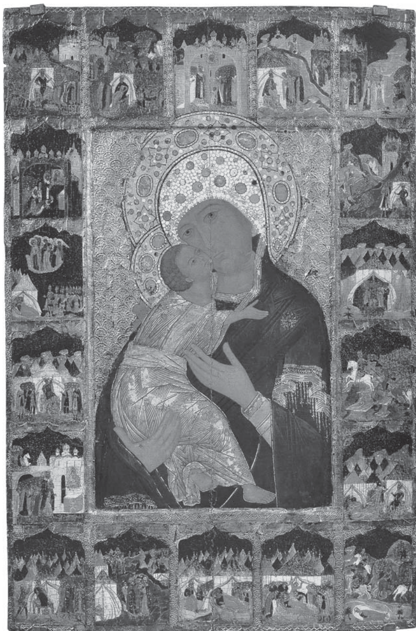
6. Богоматерь Владимирская, со сказанием в 18-ти клеймах. Икона. 1580-е гг. Мастер Истома Савин. Из церкви Похвалы Богоматери села Орла Усольского района. Поставление Никиты Григорьевича Строганова. Пермская государственная художественная галерея.