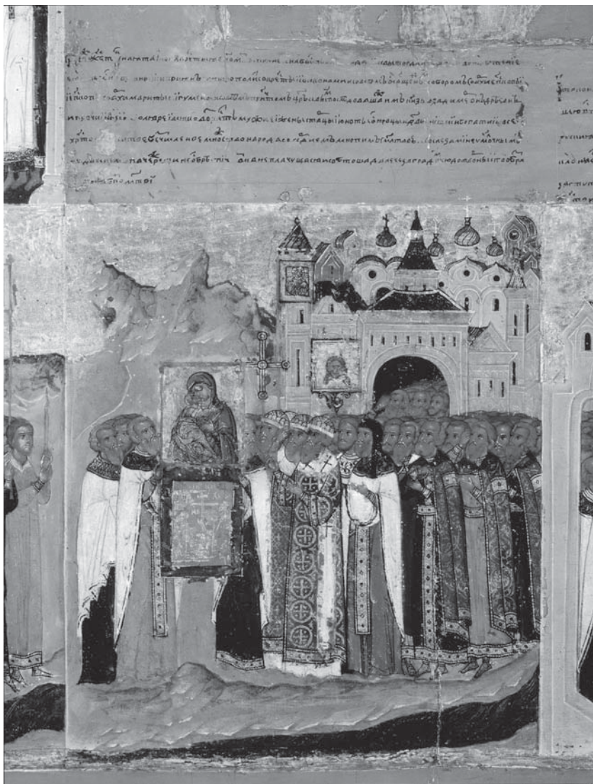
9. Сретение чудотворного образа Богоматери в Москве. Клеймо 21.

фоне горок — «на поле». Внизу темно-зеленая лента реки Москвы. В клейме «Сретение» на раме иконы «Богоматерь Владимирская», как и в большинстве других клейм, в отличие от миниатюр лицевой Повести, главным «действующим лицом» является чудотворная Владимирская икона Богоматери. Ее изображение крупное, в большинстве клейм она занимает центральное положение. Образ нарисован