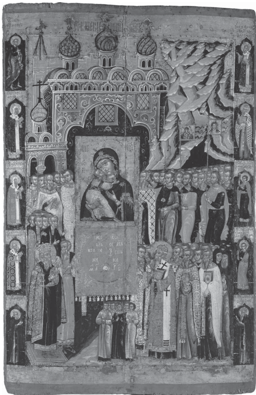
12. Сретение Владимирской иконы Богоматери в Москве. Икона. Середина XVII в. Сольвычегодский музей.