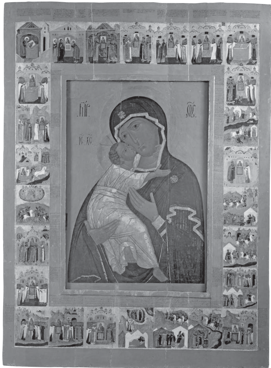
8. Богоматерь Владимирская. В раме с клеймами сказания. 1642–1644. Икона из церкви Ризположения. Музеи Московского Кремля.