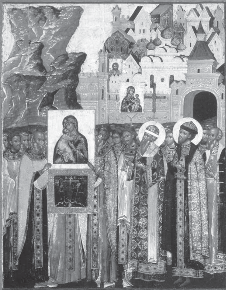
10. Сретение Владимирской иконы Богоматери в Москве. Икона. Середина XVII в. Из церкви Алексея Митрополита в Глинцах в Москве. ГТГ.