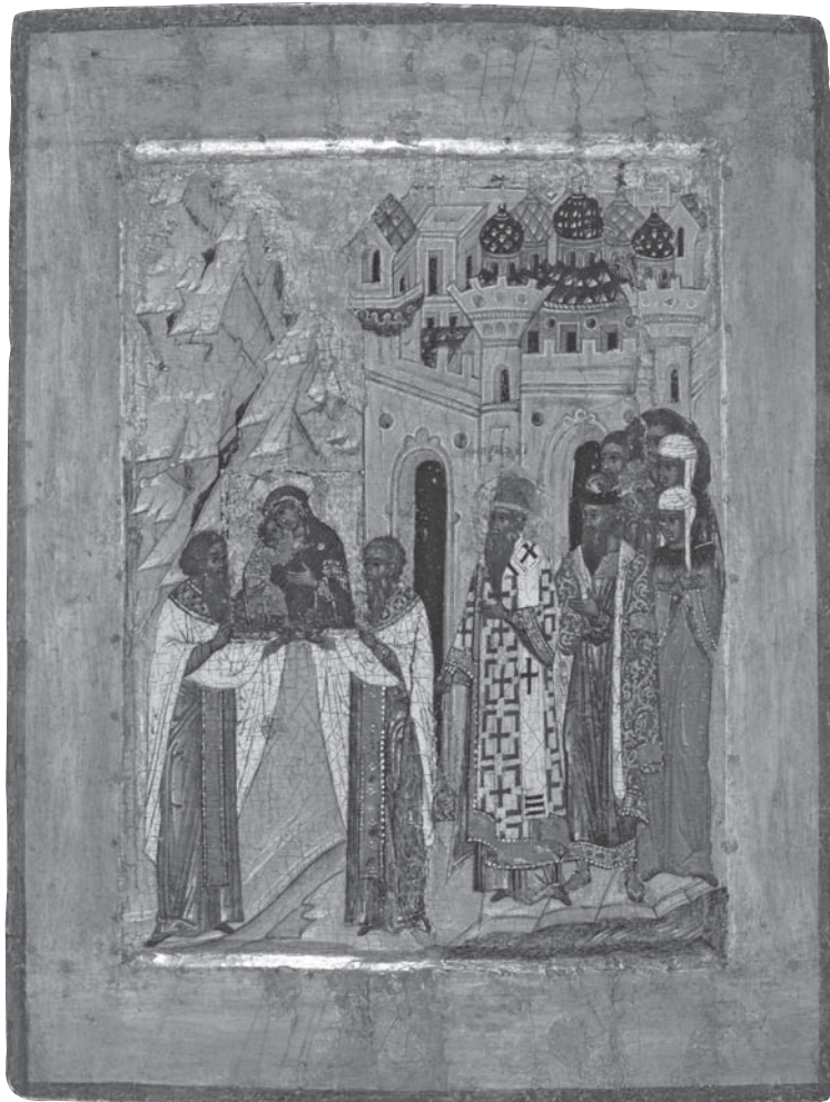
1. Сретение Владимирской иконы Богоматери в Москве. Икона-пядница. Вторая четверть — середина XVI в. Музей имени Андрея Рублева.

Третья, крайняя, фигура в правой группе — жена в красном платье и белом плате на голове, со скрещенными на груди руками. Над ней видна голова второй жены в таком же плате и еще несколько голов встречающих икону людей. В левой части иконы, на фоне охряной горы со скалистыми отрогами, — два священнослужителя в светлых фелонях, представленные в симметричных позах; между их головами возвышается большая икона Богоматери Владимирской, которую они держат на поднятых руках. Симметричная композиция