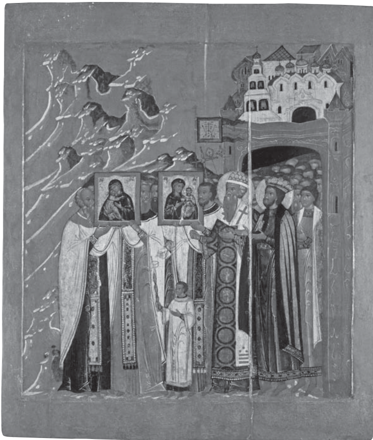
11. Сретение Владимирской иконы Богоматери в Москве. Икона. Вторая половина XVII в. Музей «Новый Иерусалим».

«Богоматерь Владимирская» нарисована очень точно: левая рука Богородицы высоко поднята, пальцы касаются рукава одежды Младенца Христа; все детали тщательно выписаны, одежды покрыты золотым ассистом. Так же тщательно выписан золотом Голгофский крест с орудиями Страстей Христовых и буквенными обозначениями на темном фоне подвесной пелены, с широкой красной каймой, затканной густым золотым орнаментом. Главным изображением в этой иконе для создавшего ее мастера (и, вероятно, заказчика) была чудотворная Владимирская икона Богоматери, ее торжественное прославление в день праздника святыни, сопровождаемого Большим крестным ходом.