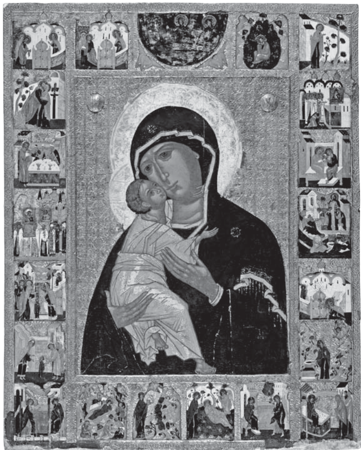
4. Богоматерь Умиление Владимирская, с клеймами жития Иоакима, Анны и Богородицы. Икона. Последняя четверть XVI в. Псковский музей.

окладом и золоченым гравированным венцом, с красной узорчатой подвесной пеленой. Икона в окладе опирается на головы иереев, их простертые в молении руки нарисованы на фоне красной пелены. Благодаря такому изображению чудотворная икона как будто вознесена «на воздухе». Слева стоит еще один священнослужитель в такой же белой фелони, за ним — плотная толпа людей (видны только головы). В центре клейма, близко к группе священников в белых фелонях, иерей в такой же фелони держит в руках древко с развилкой, на котором укреплен поясной образ Спасителя, также в реальном серебряном