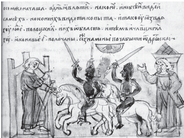
Илл. 1. Радзивиловская летопись (л. 124, низ).

Статья продолжает исследование древнерусских иллюстраций летописного рассказа 1092 г. об эпидемии в Полоцке: миниатюра Радзивиловской летописи (л. 124: илл. 1; Петрухин 2015a), иллюстрирующая сообщение о появлении днем невидимых конных демонов, навий — носителей болезни, оставляющих отпечатки копыт на теле, напоминает о балканских тодорцах и схожих персонажах европейского (и даже евразийского ) фольклора, наделенных конскими атрибутами («соседних» калушар и т. п. — Ginzburg 1991: 191; Агапкина 1999; Петрухин 2015). Замечу, что атрибутом самого св. Тодора был белый конь , как у демонов на миниатюре: сопровождающие Тодора мертвецы-оборотни являлись из преисподней и боялись дневного света (Цивьян 1999: 346). Это напрямую противоречит сюжету миниатюры — над демоническими всадниками светит солнце.