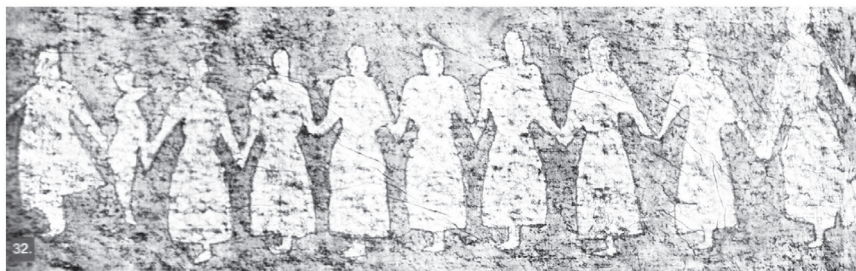
Илл. 6. Ленская писаница (Дэвлет 2005: 20, рис. 16: ср. рис. 21. 31, вклейка 32).

напоминает о сюжете древнерусской миниатюры (ср. Петрухин 1999) 4 . Следует сразу отметить, что композиция на скалах Лены явно разновременная, датируется в пределах от палеолита (!) до железного века, эпохи «всадничества» (см. Дэвлет 2005: 19 и сл.).