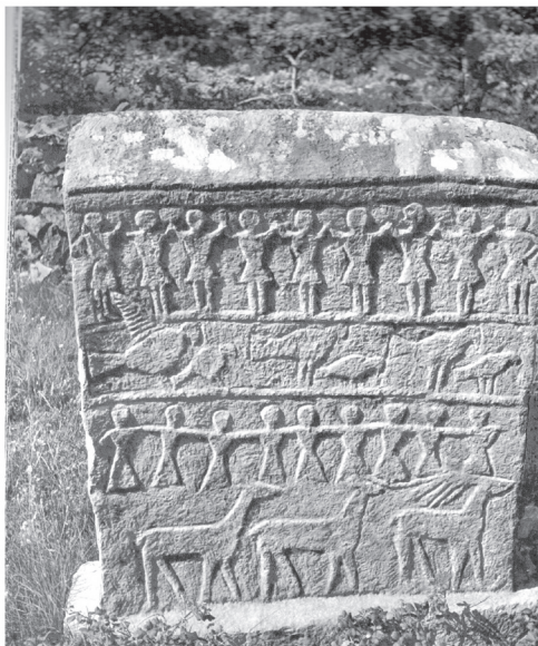
Илл. 5. Коло за мртве на средневековом саркофаге из южной Далмации (Bihalji-Merin, Benac 1962, Plate 14).

напоминают о более известной в славянской археологии ярусной композиции, включающей коло . Это знаменитый Збручский идол, на котором пьедестал с четырехликим божеством окружает хоровод из двух мужских и двух женских фигур: это коло, очевидно, воплощает земной — человеческий мир. Танцы-хороводы окружали почитаемый объект во время календарных обрядов (Агапкина 2011: 58–59) 2 . Изобразительные аналогии хороводу на идоле из Збруча давно указаны археологами, в частности в орнаменте на венчиках славянской посуды (ср. Гейштор 2014: 196; Kajkowsky 2014: 150–152). Впрочем, «орнаментальный» мотив хоровода едва ли не универсален, во всяком случае имеет евразийское распространение, если учесть знаменитые Ленские писаницы, где схематический хоровод сочетается с конскими сюжетами (илл. 6) 3 , в том числе битвой небесных всадников: солнце, освещающее битву,