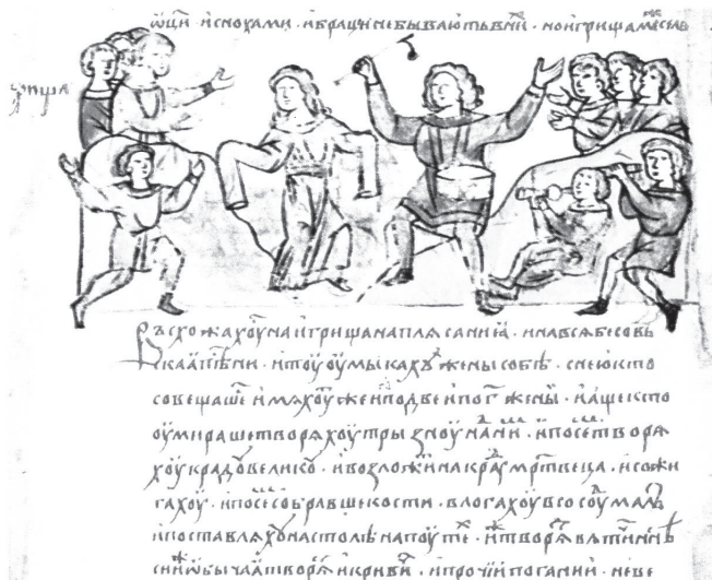
Илл. 3. Радзивилловская летопись (л. 6 об.).

О. В. Белова обратила мое внимание на то, что на «ночной» миниатюре изображено не просто навье , а навье коло, коло за мртве , известное на Балканах (ср. Толстой 1995: 160; Ристески 2000; Агапкина 2011: 64–66). По миниатюре трудно сказать, движется ли коло навий в направлении, обратном принятому у живых, как в обрядовых танцах Македонии (Ристески 2000: 134–135): существенно, что македонские обычаи призваны были обратным ходом «затанцевать» эпидемию, вызванную нечистой силой.