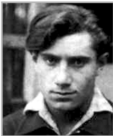
Илья Кабаков, Шарль Розенталь. Идеальный художник XX века (1921) Foto Stdaedelmuseum. De.