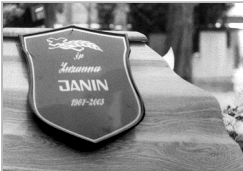
Зузанна Янин. «Я видела свою смерть / I've Seen My Death» (2003)