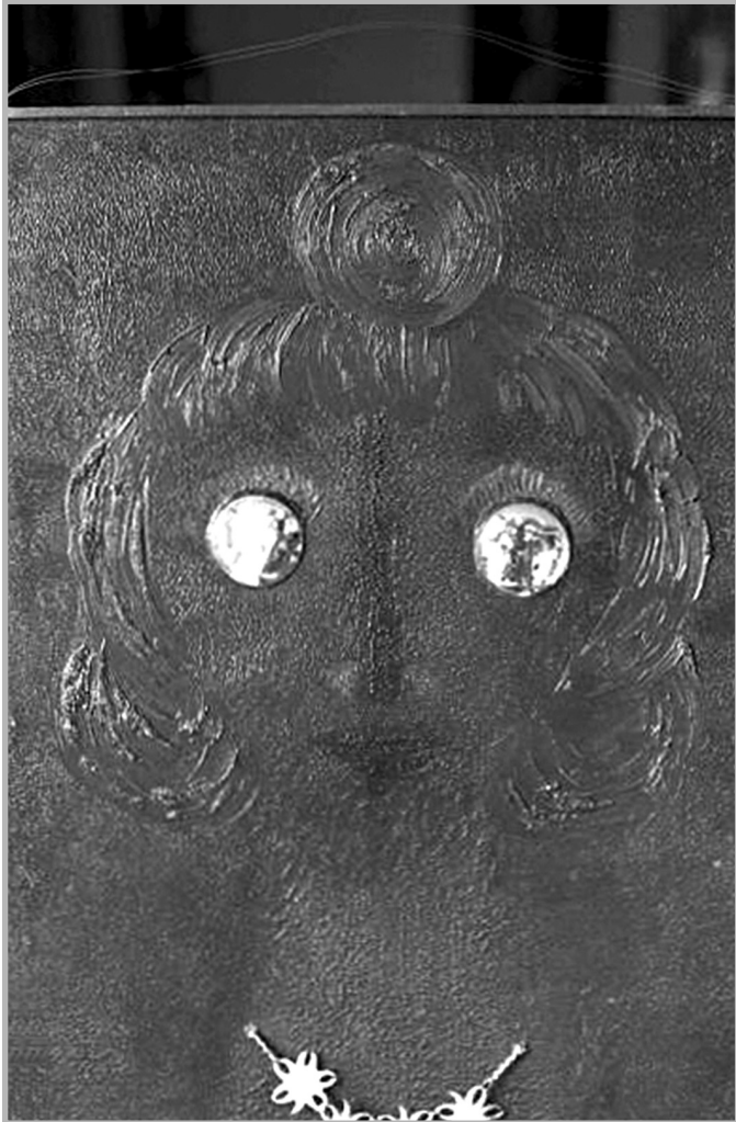
Юзеф Робаковски. «Маскировки (Юзеф Корбеля иначе Юзеф Робаковски) — Дама с ожерельем» / «Kamuflaże (Józef Korbiela vel Józef Robakowski) — Dama z naszyjnikiem» (1965)