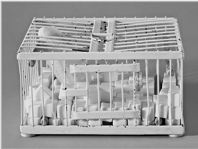
Марсель Дюшан. «Почему бы не чихнуть?». Роз Селяви / «Pourquoi ne pas éternuer?». Rose Sélavy (1921)