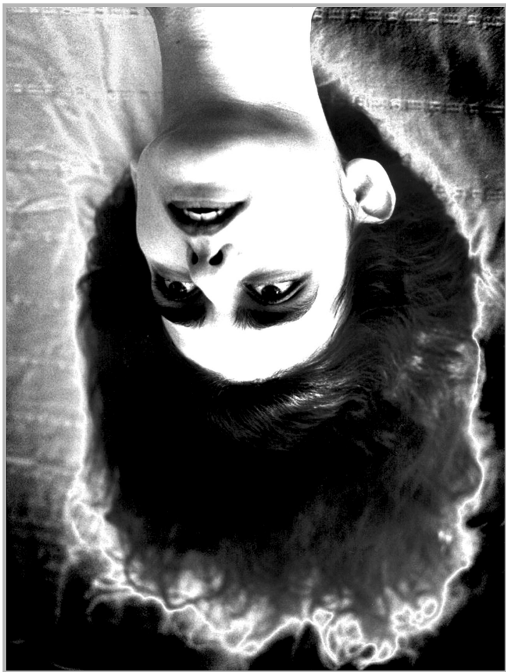
Рои Розен (Roe Rosen). «Неизвестный фотограф, Жюстин Франк» / «Unknown photographer, Justine Frank» (1928)