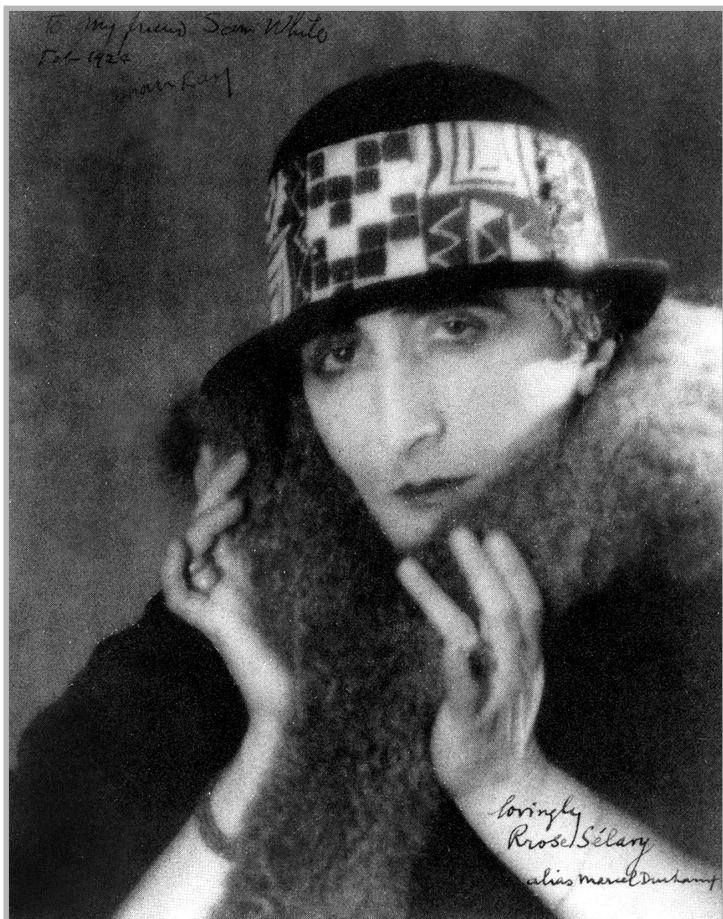
Марсель Дюшан иначе Роз / Рроз Селяви / Marcel Duchamp alias Rose / Rrose Sélavy (1921)