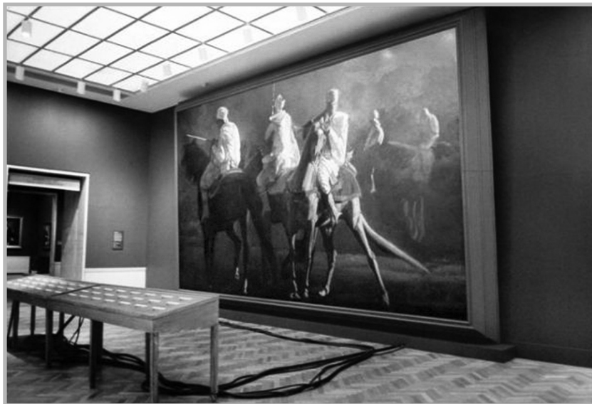
Илья Кабаков. «Протоинтернетный» шедевр Шарля Розенталя «Три всадника» (1931–1932) (1999)