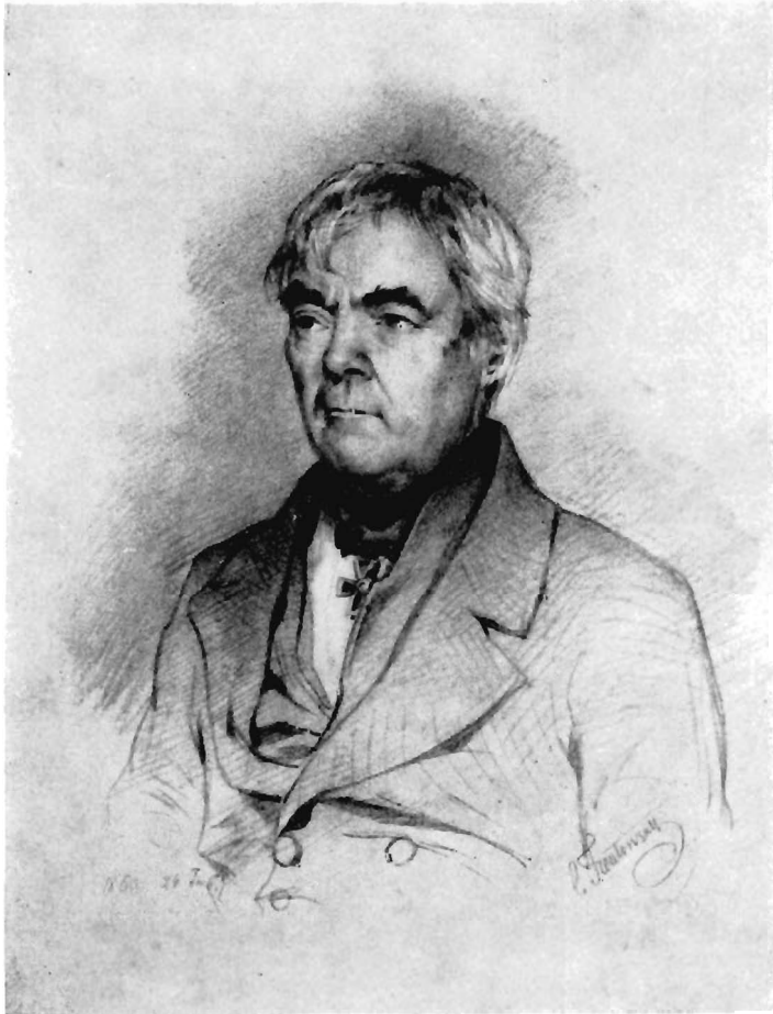
А. Н. Восток. Карандашный портрет (1850 г.) работы художника К. А. Трутовского. Публикуется по подлиннику, хранящемуся в Ленинграде в Архиве АН СССР (ф. 108)