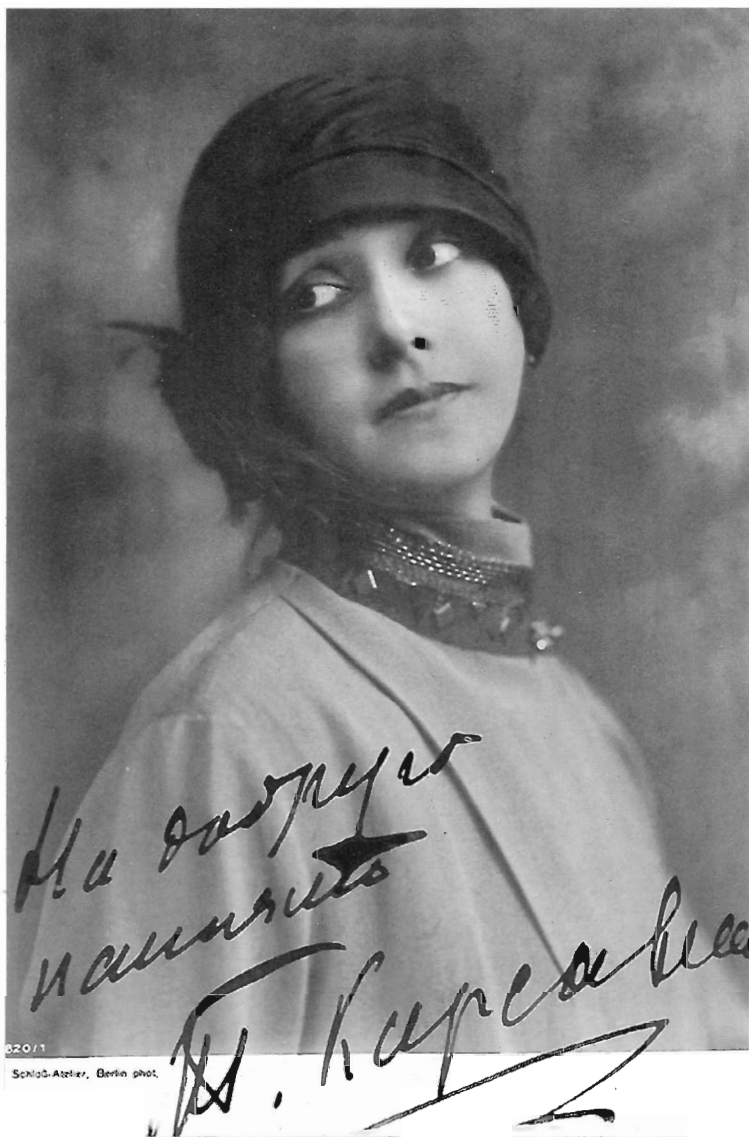
Т. П. Карсавина