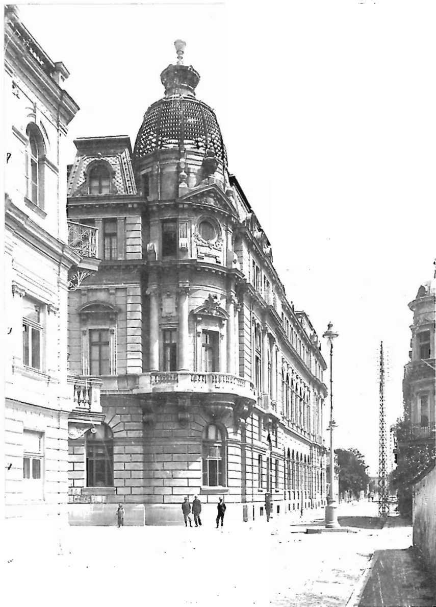
Одна из улиц Софии