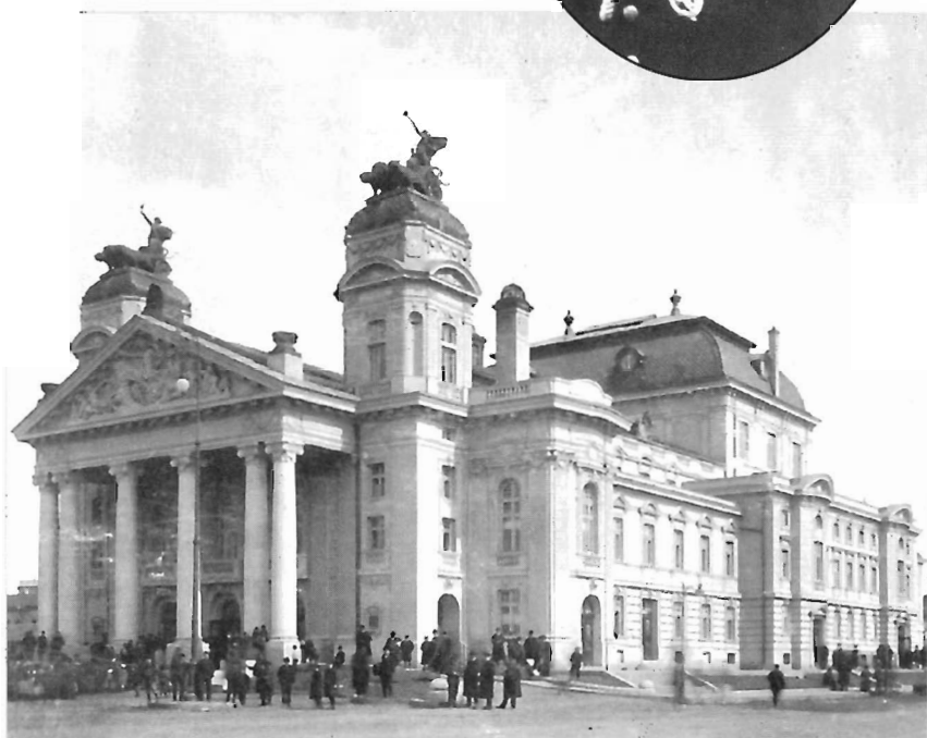
Народный театр им. И. Вазова