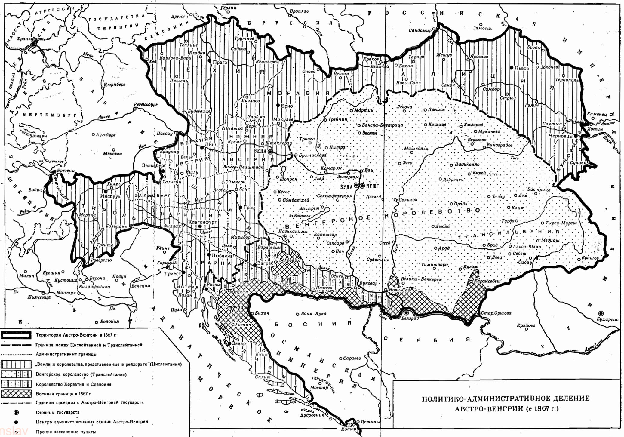
ПОЛИТИКО-АДМИНИСТРАТИВНОЕ ДЕЛЕНИЕ АВСТРО-ВЕНГРИИ (с 1867 г.)